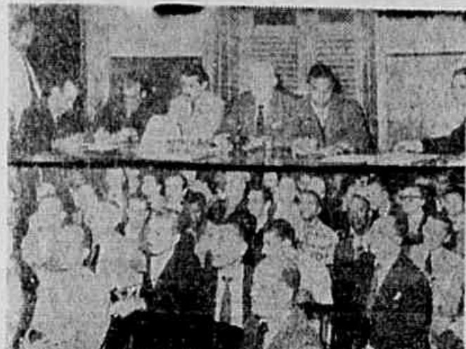
Com a presença de representantes dos Sindicatos, Federações e delegações dos Estados realizou-se importante reunião ontem no Sindicato dos Marceneiros. No clichê um aspecto da mesa que presidiu os trabalhos e parte da assistência.