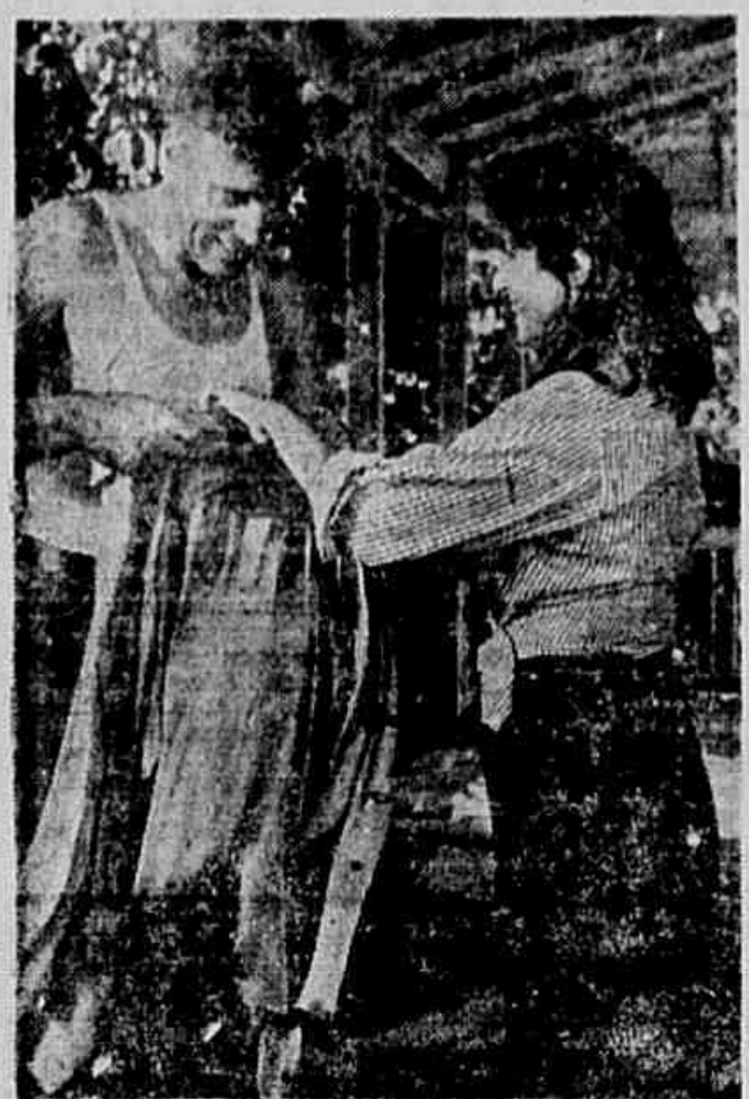
Ana Magnani e Burt Lancaster numa cena de A Rosa Tatuada, película dirigida por Daniel Mann. Vale recordar que a simpática atriz italiana recebeu o "Oscar" de melhor interpretação feminina pelo seu desempenho nesta película