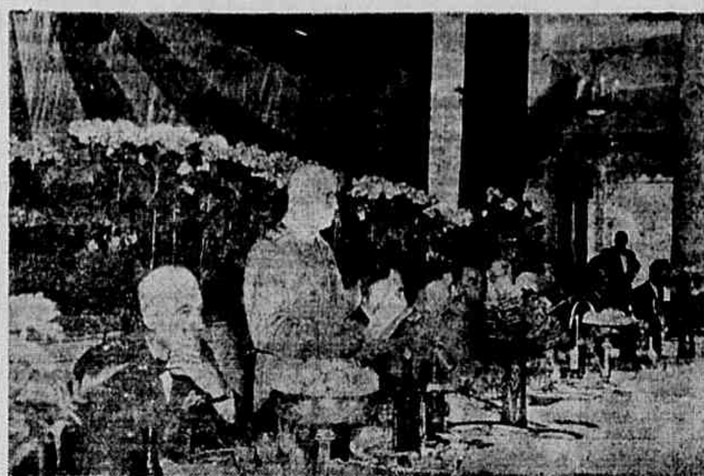
Realizou-se no Dia da Aviação, grande banquete oferecido às 28 delegações de países estrangeiros que afluíram a Moscou para participar das celebrações. Fato de singular importância, que exprime a modificação do ambiente internacional, menos tenso, constitui a presença, entre os mais destacados convivas, do general Twining, chefe do estado-maior das Forças Aéreas dos Estados Unidos. O general Twining aparece, na gravura, à direita do marechal da Aviação Soviética P. F. Jigarev, quando este pronunciava o discurso de saudação.