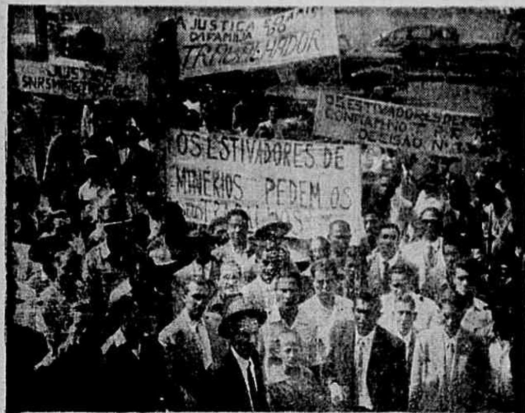
Com falas que falam de suas reivindicações e os estivadores de minérios voltaram ao TFR, esperando que mais uma vez seja reconhecido seu direito ao trabalho