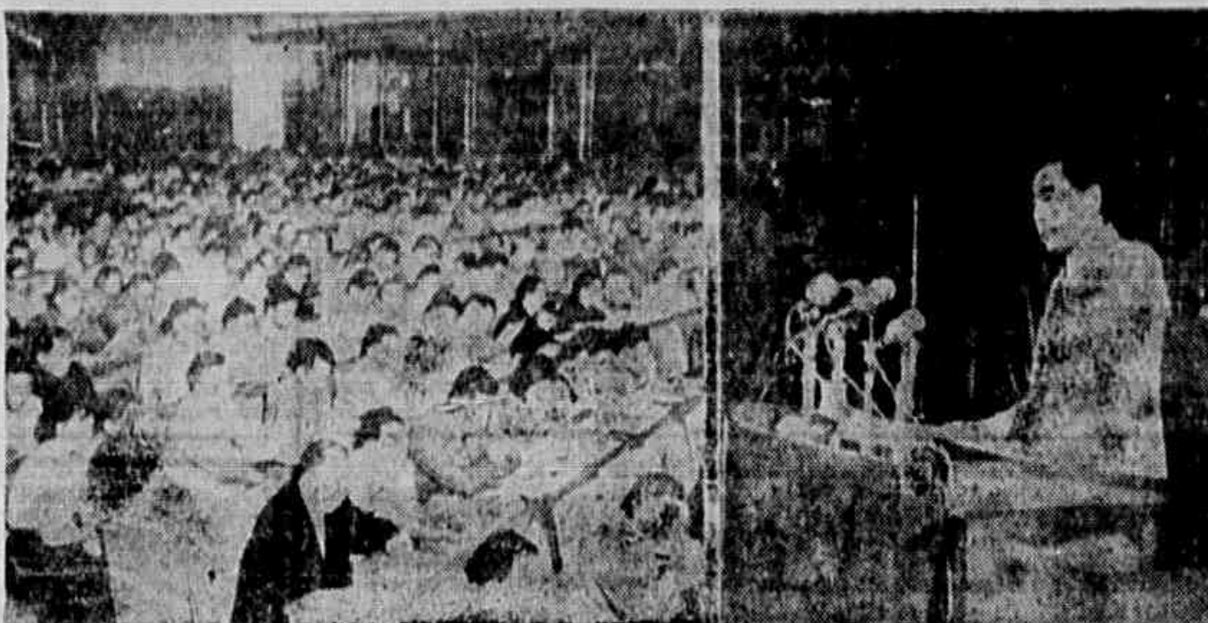
O PREMIER CHOU EN-LAI, Ministro das Relações Exteriores da República Popular da China, fala sobre a atual situação internacional, a política exterior da Nova China e sobre questões ligadas à libertação de Formosa, por ocasião da terceira sessão do Congresso Nacional do povo, realizado a 28 de junho. Na montagem, aparece o sr. Chou En-Lai, à tribuna, e parte dos participantes do conclave, do qual também tomaram parte vários deputados brasileiros componentes de uma delegação de parlamentares que visitou a China