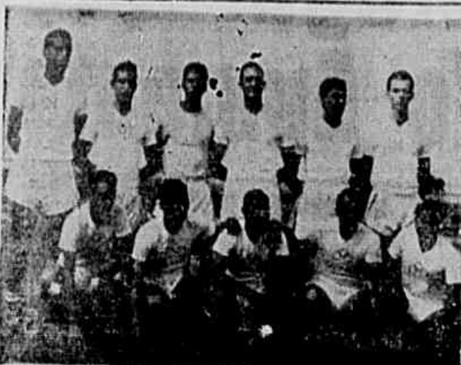
O quadro do Escritório que tentará derrotar o Preparação, vice-líder do certame