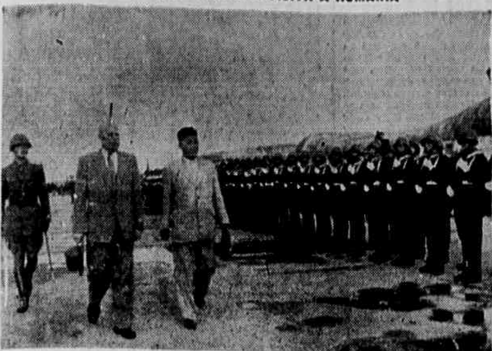
Uma delegação governamental da Coreia Popular esteve em visita à República Popular da Romênia. A delegação coreana era chefiada pelo presidente do Comitê Central do Partido do Trabalho da Coreia e presidente do Conselho de Ministros do país, Kim Ir Sen. A fotografia mostra Kim Ir Sen quando, em companhia do presidente do Conselho de Ministros da Romênia, Chivu Stoica, passava em revista a guarda de honra formada à sua chegada.