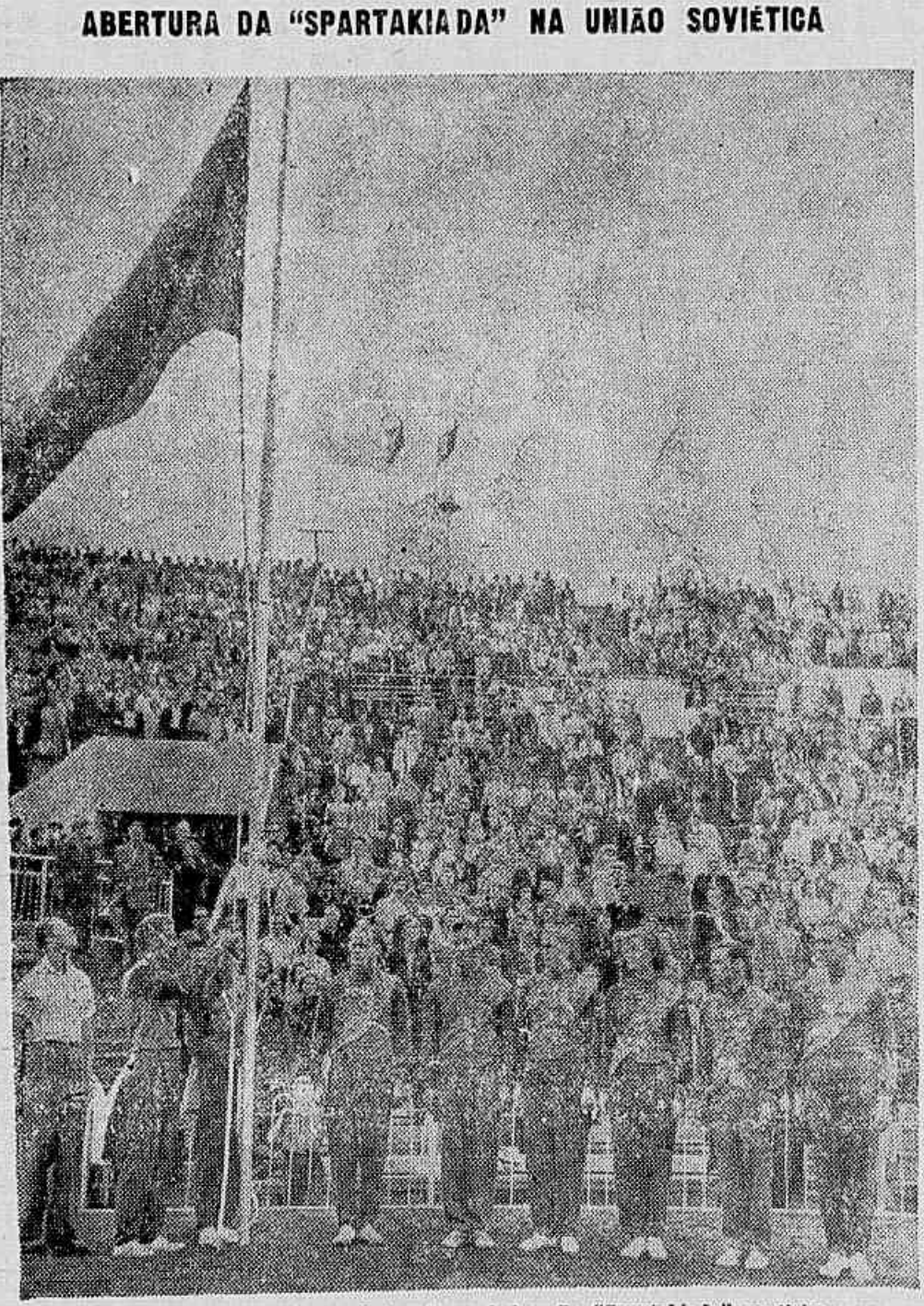
Presentes alguns dos maiores atletas da União Soviética, foi hasteado o Pavilhão da «Spartakiada», o grande certame esportivo que reúne milhares de esportistas da URSS, em disputa de provas de todas as modalidades.

Manobra dos garagistas utilizando o nome dos motoristas individuais