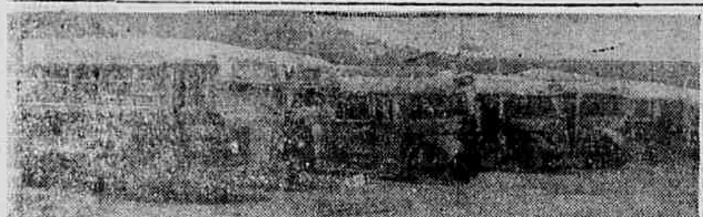
Orienta ônibus parados na garagem da Empresa Suburbana, uma das constatações ontem feitas pela Comissão Permanente Contra a Carestia no comando realizado pela direção de operações