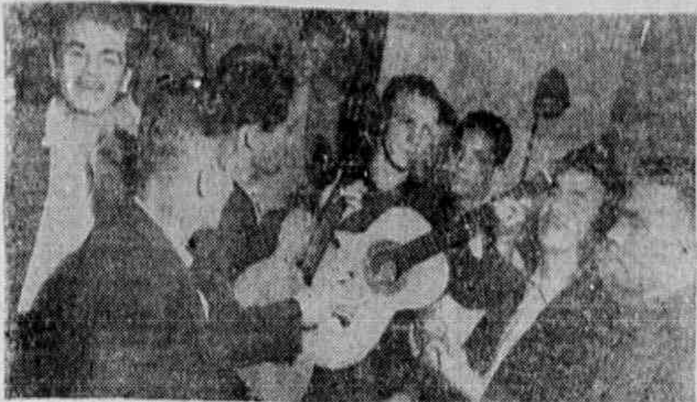
Circetistas reunidos ontem no Sindicato dos Pilotos e Aeronautas. Durante todo o dia o ambiente foi animado com muita música e dança