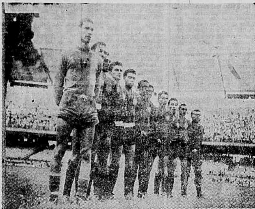
O quadro do Bonsucesso mostrou que é de bola no Torneio Início

Ontem, pela manhã, o Bonsucesso encerrou os seus preparativos, com um ensaio co-