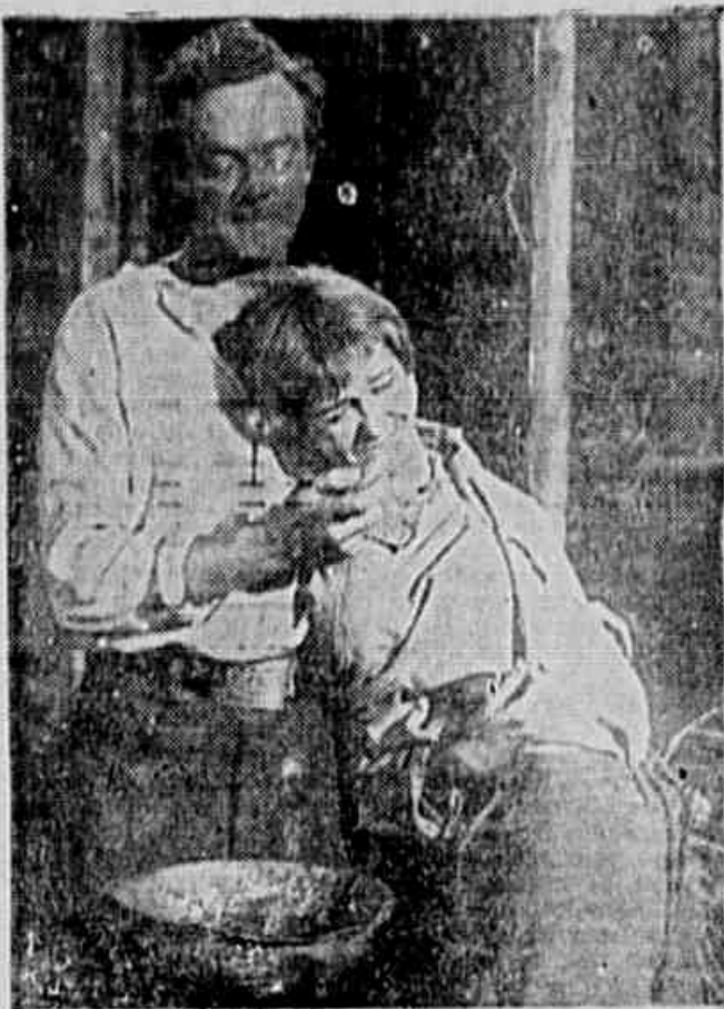
Joanne Woodward e Van Heflin numa cena de "Vale da Redenção". O filme é fraquíssimo mas revela uma atriz promissora, pois Miss Woodward é uma revelação.