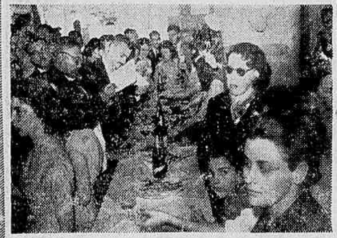
Realizada a VIII Convenção dos Contabilistas Fluminenses

Despacho distribuído, ontem, pela «France Press» dá a assistência de um comunicado conjunto, ass. pelo sr. Lucas Lopes e pelos diretores do Banco de Exportação e Importação, ao término das negociações para a concessão de um empréstimo americano ao governo brasileiro, evidentemente lesivo ao nosso país. ASFIXIA DO DESENVOLVIMENTO Iniciando com a exigência de um controle da inflação,