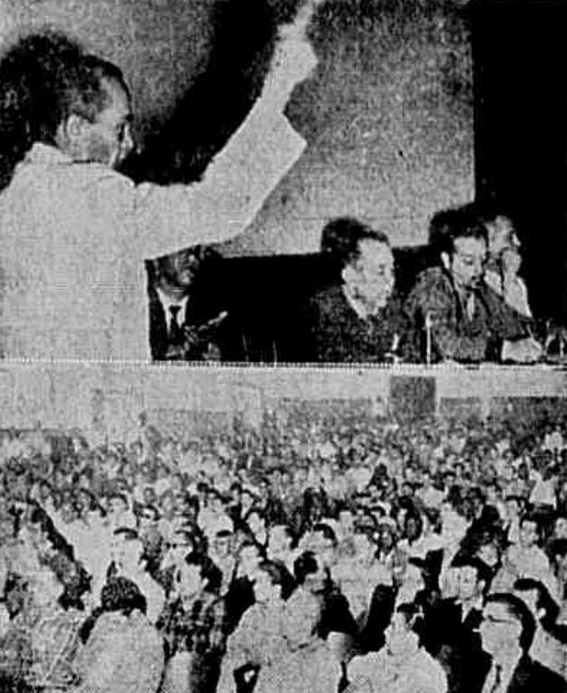
Quis Fazer o Jôgo da Polícia e Teve Que Renunciar ao Cargo