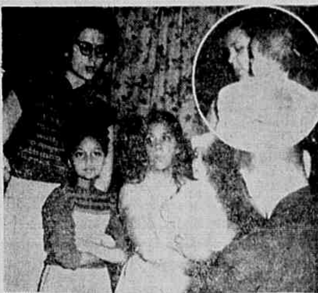
No clichê e no medalhão as mulheres e crianças que foram vítimas da estupidez e das violências dos "Coices de Mula"