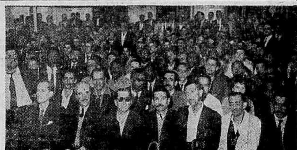
Flagrante da assembleia de ontem dos trabalhadores em carris urbanos, momentos antes de chegar o sr. João Goulart

docilmente aceita pelo Itamaraty. As denúncias do deputado Archer são feitas por meio de documentos secretos que o representante maranhense levou ao conhecimento da nação, depois de consultado o próprio presidente da República. (Conclui na 2.ª Página)