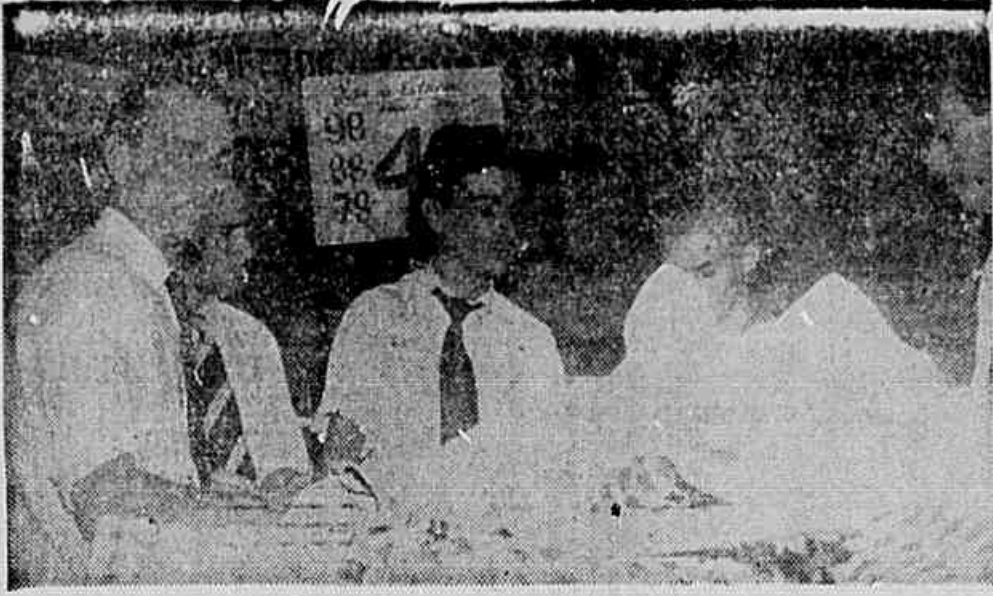
Um reajustamento salarial vem em boa hora. Com o salário atual não podemos continuar a viver. Estaremos no sindicato dia 5 pois deverão sair importantes deliberações — disseram os comerciantes da Seda Moderna

JÁ EM VIGOR O AUMENTO ESPETACULAR — MINDELO DIZ QUE A COFAP NÃO TINHA ELEMENTOS PARA LEVANTAR O CUSTO DO AÇÚCAR — MAS NÃO DISSE QUE DESPREZOU O PARECER DE UM CONSELHEIRO QUE APONTOU A REFINARIA DO I.A.A. COMO DETENTORA DE UM LUCRO DE CR$ 43 MILHÕES ANUAIS