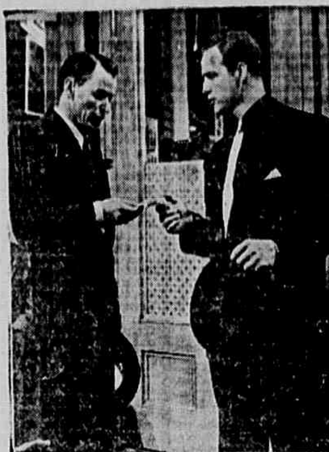
Karlovy Vary serviu para quebrar os "gelo" que havia entre o cinema americano e de democracia popular. Entre os filmes americanos que os tchecoslovacos querem ver estão «Marty» e «Ela do qual vemos uma cena onde aparece Frank Sinatra e Marlon Brando, que são também conhecidos por lá».