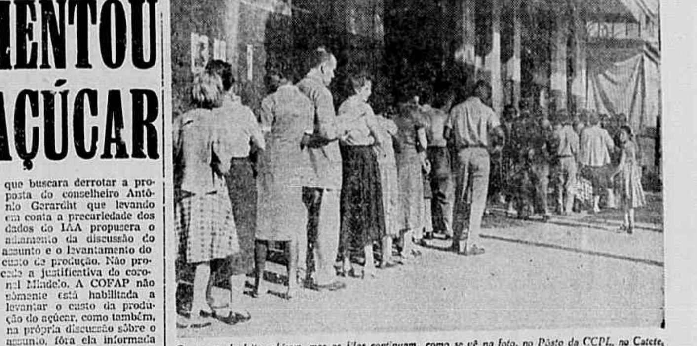
Os preços do leite sobram, mas as filas continuam, como se vê na foto, no Posto da CCPL, no Cate, e a CCPL ainda quer mais um aumento. Agora, de 1 cruzeiro por litro

Executivo, em 1952, estabelecendo o padrão único de 60 ciclos para todo o país. NOVA REUNIÃO No momento, a Comissão Técnica de Rádio, que marcou uma nova reunião para o próximo dia 11 de setembro, limitou-se a reunião de consulta que realizou, com a presença de representantes de fábricas de aparelhos de televisão e de estações transmissoras, tendo ainda acompanhado vários representantes de empresas interessadas nos canais de TV pertencentes ao governo e ainda inexplorados. Nenhuma deliberação como ficou dito, foi tomada, entretanto espera-se que a reunião do próximo dia 11 estabeleça as normas para remover as pequenas dificuldades técnicas ainda existentes, para que se possa adotar a televisão em cores no Brasil, bem como efetuar as retransmissões entre Rio e São Paulo, o que aumentará de muito o interesse dos telespectadores e dos anunciantes.