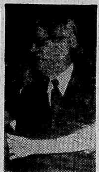
Ministro Maurício de Medeiros, que foi agredido pela polícia da Aeronáutica