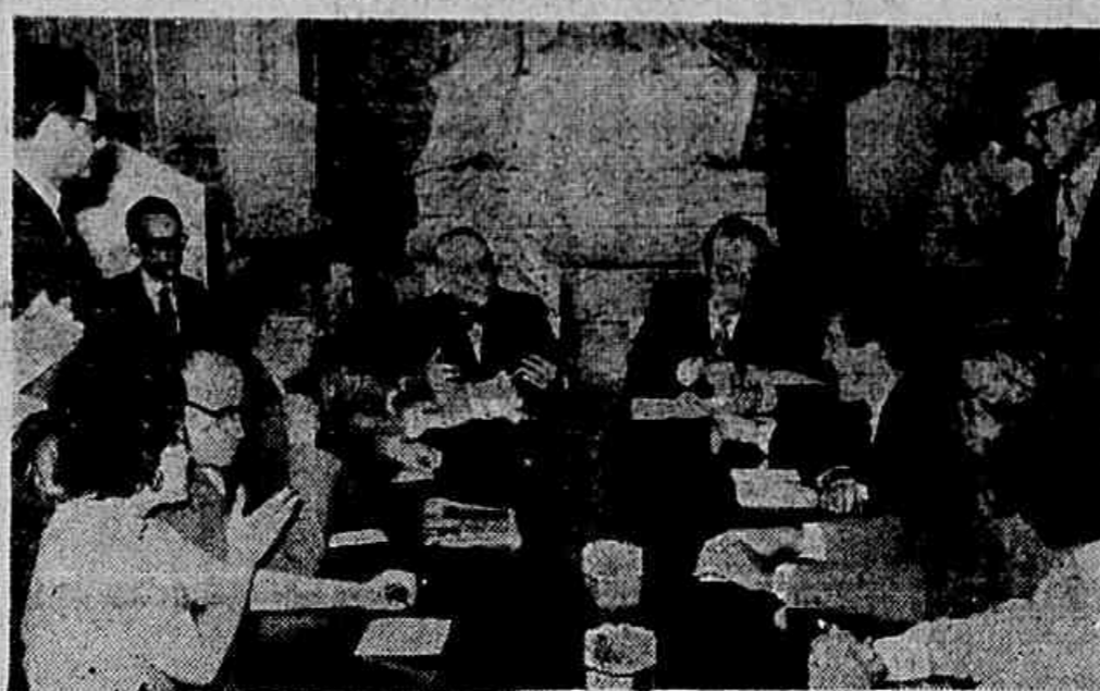
No clichê, a Comissão de Diplomacia da Câmara em sua reunião de ontem, pela primeira vez ouvindo um ministro do Exterior, chanceler Macedo Soares, em exposição prévia sobre a posição do Brasil numa reunião de encontro com representantes de outras nações