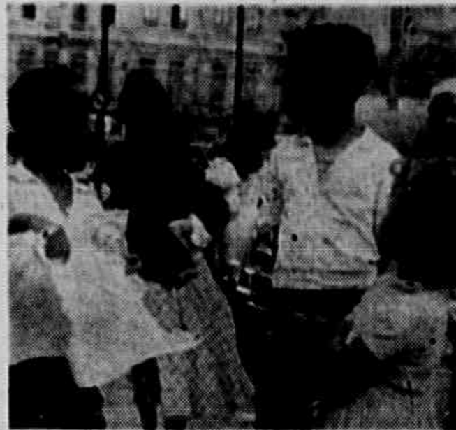
Cosme e Damião, Missas e Saravás

As autoridades sanitárias não desconhecem, por outro lado, as condições de promiscuidade a que se vêem forçadas as populações das favelas, os alunos das escolas públicas e o transporte urbano.