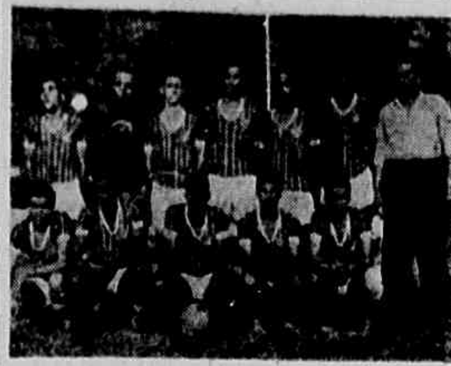
Esta é a equipe da Juventude que fará hoje a sua primeira apresentação em Honório Gurgel

O Grêmio Esportivo Pompeu aceita jogos amistosos, primeiro e segundo quadros e juvenis. Ofícios para Rua Senador Pompeu, 10, sobrado ou entendimentos pelo telefone 23-1328, das 9 às 12 horas.