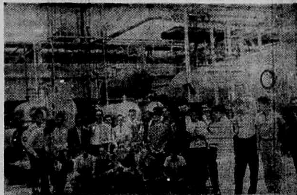
Aspecto da visita que os secundaristas fizeram ontem à Refinaria de Mangunhos, vendo-se o alegre e numeroso grupo tendo ao fundo as instalações daquela empresa