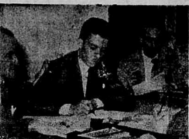
Membros da comissão de festa, quando, ontem, estavam reunidos, em sessão da U.N.S.P.

Confraternização hoje, no High Life, de todas as associações de servidores — Especialmente convidados o presidente da República e ministros — Nota da UNSP — Texto na segunda página