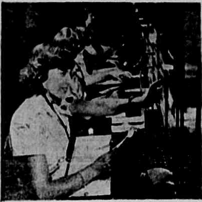
Trabalham oito horas consecutivas, executando função executiva e equivalente a de tantas outras, cuja duração regulamentar por dia é de seis horas apenas. Por isto, passam as telefonistas, que, agora, se empenham em luta por seis horas também de trabalho diário e por um vencimento menos mingado.

arrendatário da cantina situada entre os armazéns 5 e 7. E, diante disto, foi montada uma comissão, sem que fosse exigida em aguardado o resultado dos trabalhos da primeira. Conclusão o portuário: "Queremos que o superintendente ponha em prática suas promessas. Mais ação e menos palavras."