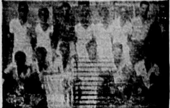
A equipe do São Cristóvão continua na liderança