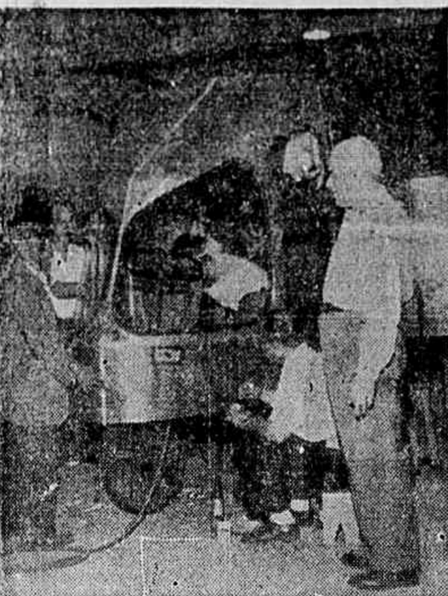
O popular "Camundongo" acompanha o trabalho final em seu novo transporte, construído em poucos dias pela "Cermava".