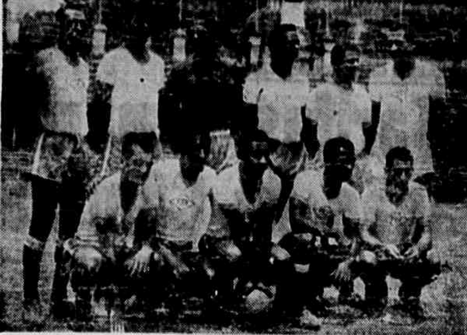
Os jogadores que aparecem na foto estão em condições de representar o futebol carioca...