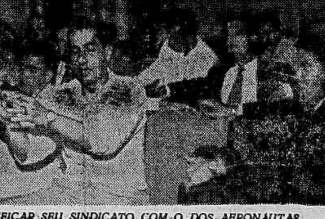
FLAGRANTE DA ASSEMBLÉIA DE ONTEM DOS PILOTOS, QUANDO DECIDIRAM UNIFICAR SEU SINDICATO COM O DOS AERONAUTAS

Decidida a fusão dos dois sindicatos, serão, agora, convocadas as eleições para a diretoria do novo sindicato.