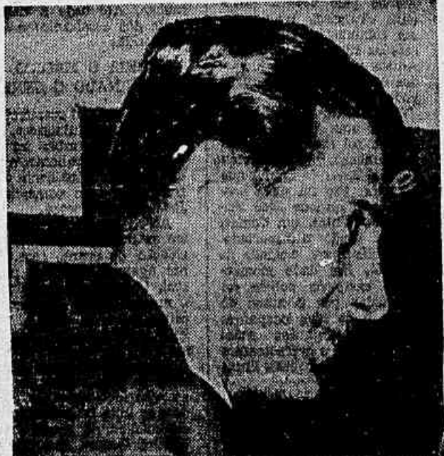
BOSICK retornou à Hungria e não virá ao Brasil

do Honved ao Brasil. Tanto que sua partida da Itália rumo à América do Sul, anunciada para 1º de janeiro, não se concretizou, a concluir-se pela inexistência de qualquer noticiário a respeito por parte das agências telegráficas.