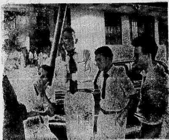
A reportagem de IMPRENSA POPULAR na Estrada do Ferro quando ouviu um grupo de motoristas sobre a polícia secreta

INDIGNAÇÃO ENTRE OS PROFISSIONAIS DO VOLANTE — SERIA MAIS UM GRUPO DE ACHACADORES PARA ESTORQUIR MOTORISTAS E PASSAGEIROS (TEXTO NA SEGUNDA PAGINA)