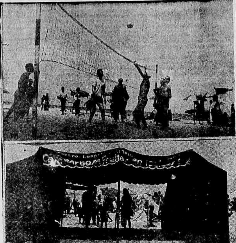
Durante o domingo, as praias, esplanadas de barracas, regurgitaram de gente. E o esporte praticado a beira-mar foi a solução encontrada pelos jovens da capital

Não bastassem os aumentos surgidos nos últimos dias, outros vêm sendo anunciados. Assim, as viagens Rio-Petrópolis, que custam atualmente 33 cruzeiros, já estão sendo ameaçadas de aumento. O DNER estuda agora uma elevação de tarifas, anunciando-se desde logo que as passagens passarão de 33 a 45 cruzeiros, ou seja, sofrerão um aumento de quase 40%. E que significa certamente que até a fuga do carioca ao calor será mais cara, justamente quando chega o verão.