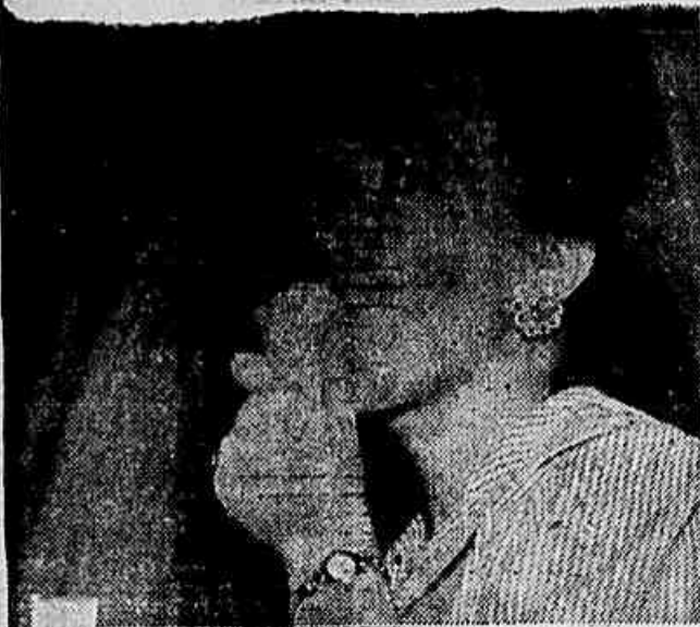
O sorvete foi um dos recursos encontrados pelo carioca (e pelas cariocas também) para abreviar a canícula

O carioca voltou a viver, nos últimos dias, o calor intenso do verão, que caracteriza a capital nos meses de janeiro, fevereiro e março. Assim, ontem mesmo, um domingo em que a cidade passou sob uma elevada temperatura e sob o sol escaldante, os lugares preferidos foram as praias, que regurgitaram de gente, e os jardins, notadamente a Quinta e o Alto da Boa Vista, onde uma imensa massa humana — homens, mulheres e crianças: famílias inteiras — procuravam o abrigo e a sombra das árvores e da vegetação para abrigar-se. SOL A PINO Já ontem, o calor adquiriu maior intensidade. Segundo o Serviço de Meteorologia, a temperatura acusará nas últimas horas uma elevação de 3 graus, alcançando a média máxima registrada cerca de 33,1. Por isso mesmo, não era de estranhar que durante o dia