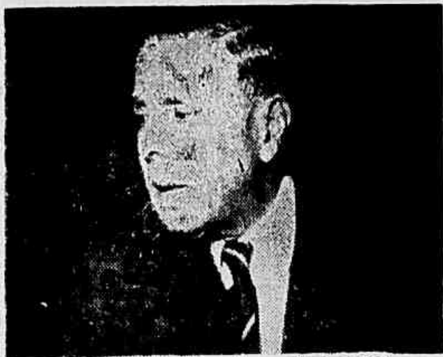
O ex-deputado João Mangabeira, presidente do PSB

A torcida do Flamengo deu mostras, anteontem, de um sadio espírito esportivo incentivando e aplaudindo sempre os jogadores do AIK contra seu próprio clube. Isto porque as circunstâncias em que se realizava o colóquio, entre as quais a canícula arrasadora, colocava o time tri-campeão em grande vantagem. Os louros rapazes escandinavos como pregados ao chão assistiam boquiabertos às evoluções dos rubro-negros. A torcida, então, resolveu animá-los e acabou satisfeita com o segundo tento do AIK marcado por penalidade.