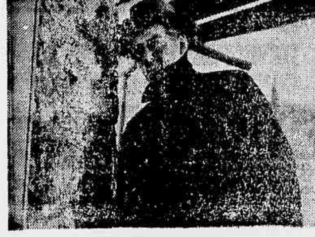
JEAN SERVAIS, no seu desempenho de RIFIPI

UMA semana com 3 estréias importantes, a saber: "RIFIPI", "Quinto da Morte" e "As Férias de Mr. Hulot". Além disso há diversidade de gêneros — comédia, drama e fantasia. Completando temos um filme mexicano com boas referências — "A revolta dos condenados" — e um novo festival de "O gordo e o magro".