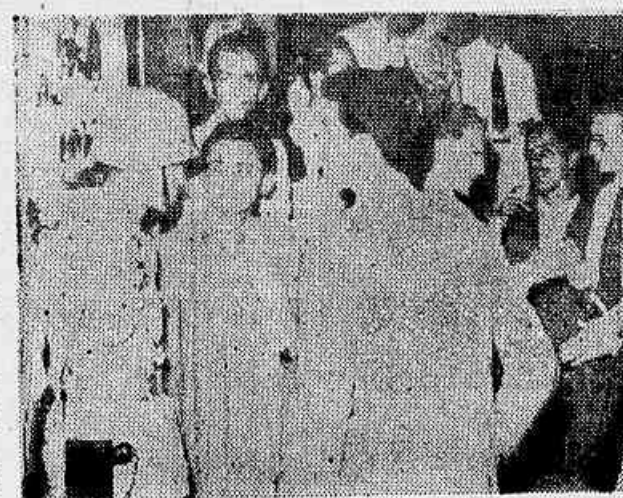
No cine Rex, a exibição foi suspensa por algum tempo. Os espectadores, em compensação, não saíram desapontados, pois receberam de volta o preço do ingresso.

Nos vários cinemas que estão exibindo a propaganda pelo filme registraram-se incidentes. No São Luiz, uns poucos rapazes, influenciados pela propaganda, tentaram repetir as deploáveis cenas assinaladas em outros países. Após dan-