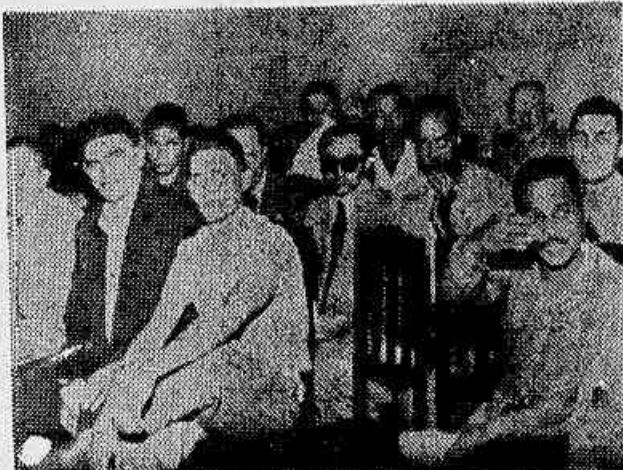
Os foguistas reunidos ontem na sede de seu sindicato

cebida dos demais sindicatos e da CNTI, voltam ao trabalho os trabalhadores da Confiança (conclui na 2ª página)