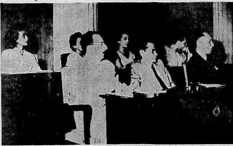
O CONSELHO DE JUSTIÇA

Estando afastada qualquer possibilidade de adiamento do caso, o processo terá prosseguimento. A audiência, do processo iniciado ontem, suspensa às 14 horas, será reiniciada hoje, às 9 horas. (FP).