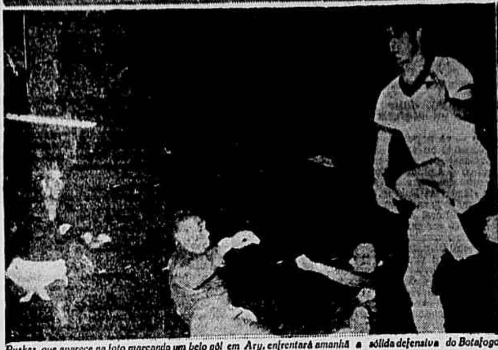
Puskas, que aparece na foto marcando um belo gol em Arg., enfrentará amanhã a sólida defesa do Botafogo