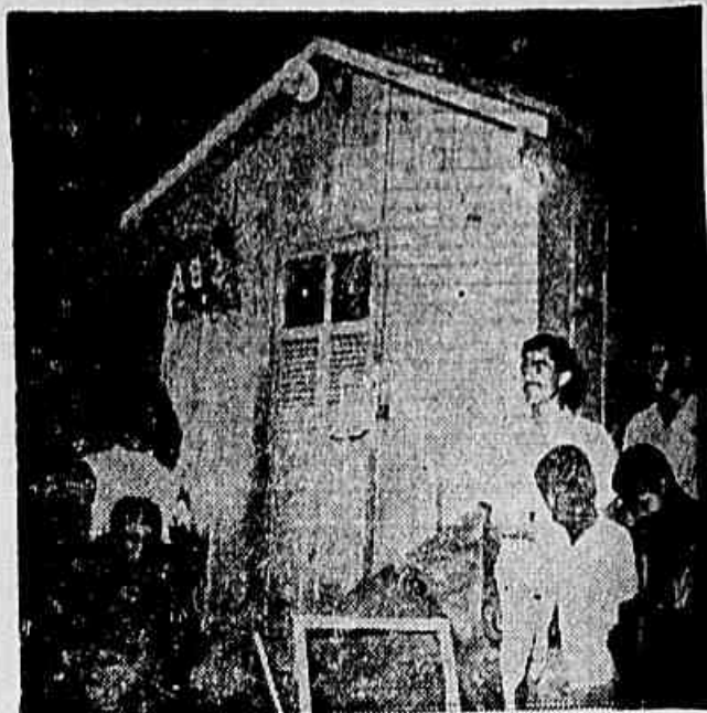
Nem o posto médico que funciona na sede da U.T.F. no Morro do Borel escapou à sanha policial. Na foto vê-se a porta da U.T.F. ilegalmente interditada ontem pela polícia de Pedrosa e I.R.

Plano para fechar as organizações populares — Interditada a sede da União dos Trabalhadores Favelados no Morro do Borel — Presos e espancados cinco diretores daquela sociedade beneficente (Texto na 2ª página)