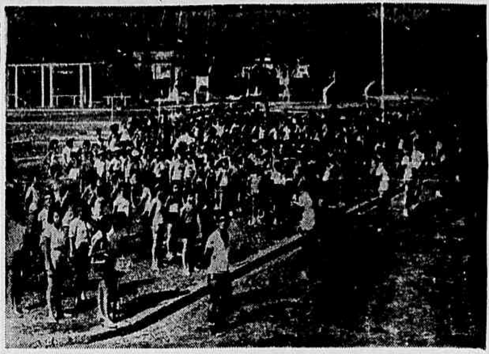
VIDA AO AR LIVRE — A Escola de Educação Física do Exército, pioneira no Brasil da educação física metodizada e praticada cientificamente, mantém um "Curso de Férias" onde, todas as manhãs, numerosos escolares praticam os mais variados exercícios orientados por oficiais e sargentos especializados. São admitidos no curso crianças de ambos os sexos, independente de qualquer gasto financeiro e da condição dos pais. Apenas se exige exame médico, que é feito na própria Escola e sem despesa de espécie alguma. As matrículas são abertas apenas às crianças de 4 a 11 anos de idade. A principal finalidade do curso é proporcionar às crianças vida ao ar livre e em ambiente saudável, no decorrer do período das férias escolares. Na foto, jovens de ambos os sexos entregam-se à prática de exercícios físicos na ENEF.