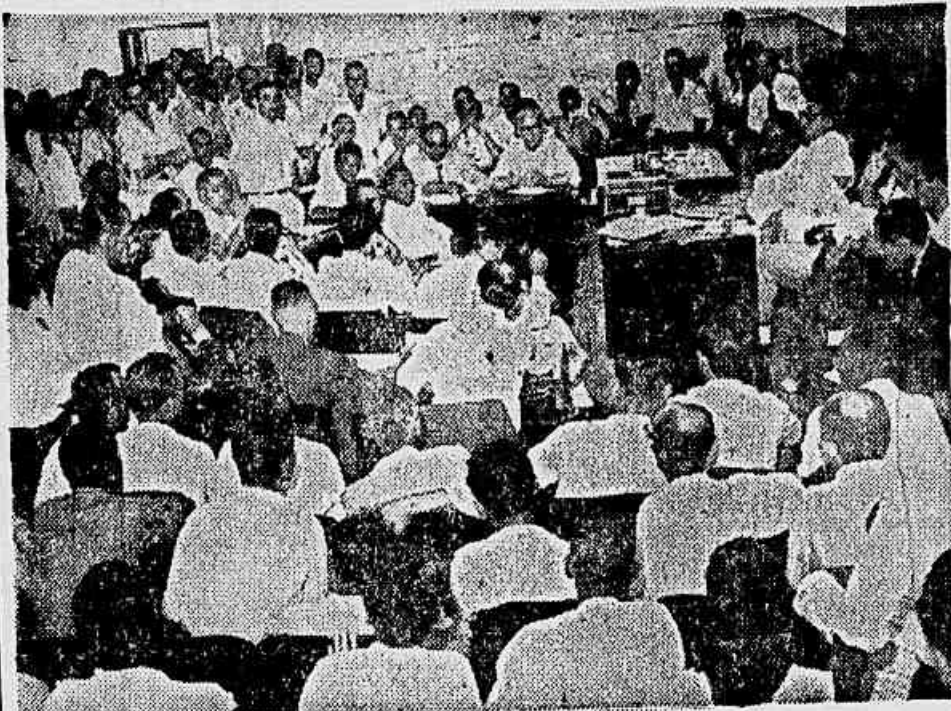
O grupo Carreteiro volta a sonegar pagamento do aumento de salários aos seus trabalhadores. Esta a denúncia, que foi feita, na última reunião do conselho de representantes da Federação Nacional dos Marítimos (foto), do que damos noticiário na sexta página