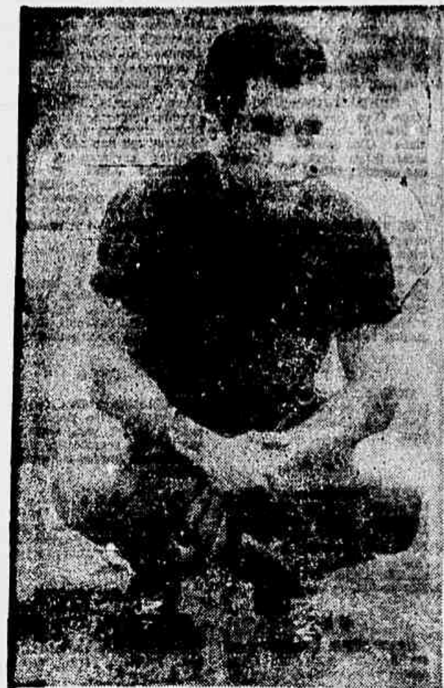
Bobá espera contribuir para a reabilitação do Flamengo

Segundo se pôde saber o Vasco da Gama se desculpa dizendo que recebeu um aviso de que havia uma partida mal, no dia em que jogou com o Colo-Colo, último jogo de que tinha notícia, sendo-lhe então impossível realizar tal partida porque já tinha contrato para jogar em Lima.