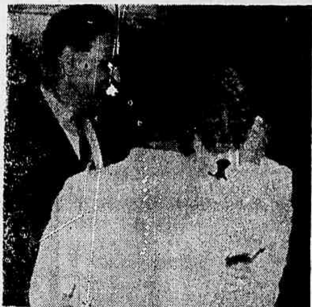
Tão logo desceram do automóvel, os membros da comissão do professor Guilherme Estellita surpreenderam-se com a "recepção", como vemos na foto acima. Embaixo, um cavalheiro passa o lenço no reitor Pedro Calmon, atingido por algum irreverente projétil

Como fora anteriormente anunciado, reabriu-se no dia de ontem o restaurante do SAPS na Praça da Bandeira. O restaurante estivera fechado durante muito tempo em consequência da realização de obras para melhoramento de suas instalações. Ontem, na hora do almoço — foto — a afluência de comensais não foi muito grande já que pouca gente sabia da reabertura. Na hora da janta, porém, a afluência foi bem maior.