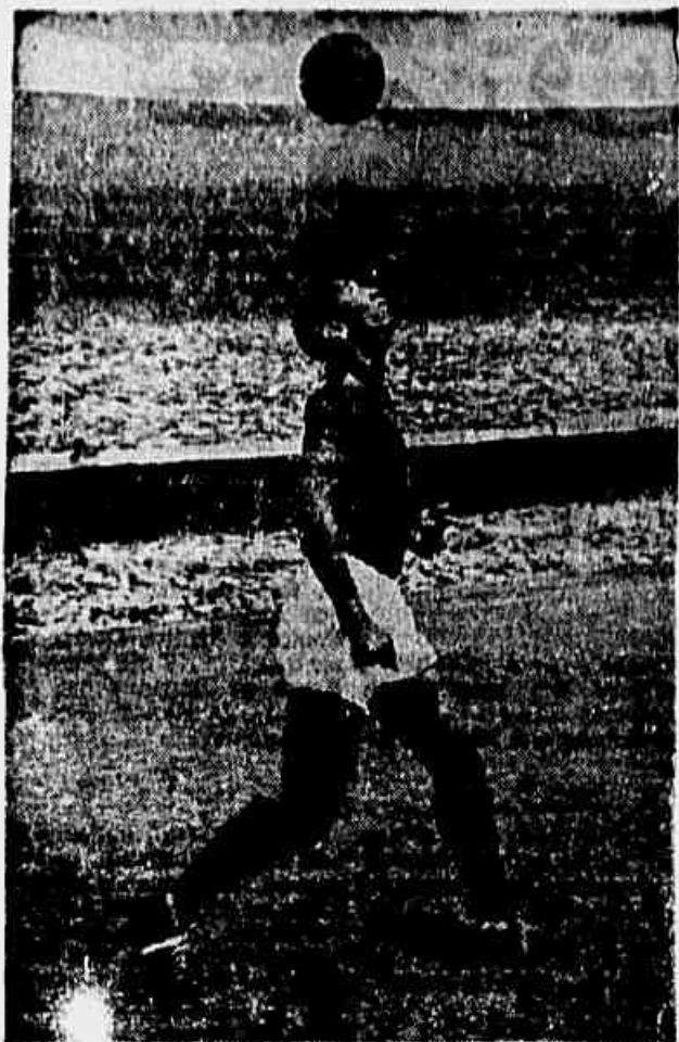
Indio continua no comando da ofensiva carioca