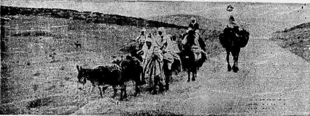
A Caravana atravessando os caminhos do deserto. O seu guia, apesar de incerto do seu dia de amanhã, vive o seu momento, hoje, cuidando de sua prole e defendendo a sua liberdade. Somente, curva e cabeça diante do sol nascente para adorar a Allah.

VIENNA, 8 (FP) — O sr. Adolf Schaff, vice-chanceler federal e presidente do Partido Socialista Austriaco, foi apresentado por seu partido como candidato às eleições para presidente da República, que se realizarão a 5 de maio vindouro.