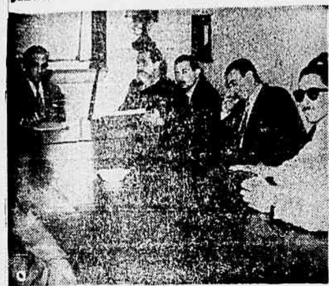
Flagrante da mesa-redonda de ontem entre fumageiros e representantes dos empregadores.