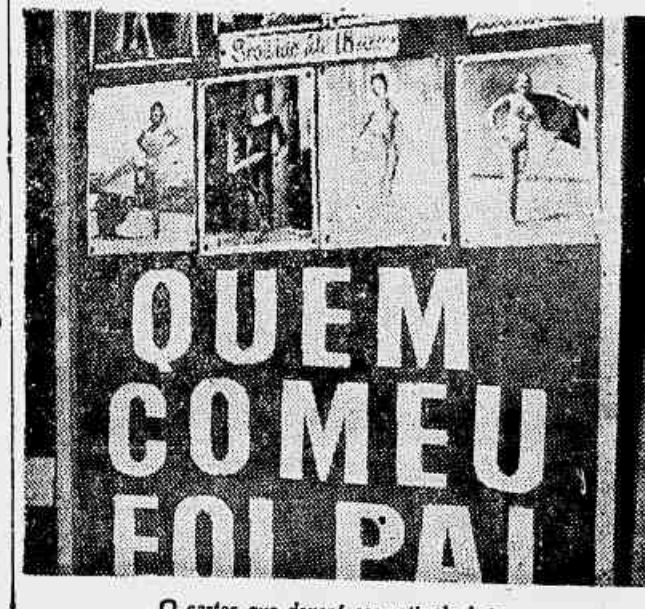
O cartas que deverão ser retiradas hoje

Provando que a Justiça é cega (até para as nossas belas vedetes) o Juiz desobedeceu a sentença e as fotos deverão hoje serem retiradas.