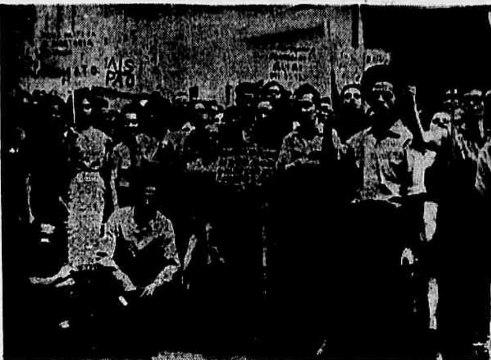
Operários e operárias da indústria do fumo concentraram-se, ontem, no Ministério do Trabalho, aguardando os resultados dos entendimentos.

AUMENTO Reivindicam os operários 15 por cento de aumento sobre os salários atuais. Os patrões, que, há pouco, foram obrigados a conceder 15 por cento, alegam, agora, nada mais poder dar. Isto, porém, não é aceite pelos operários, pois, inicialmente, reivindicavam 30 por cento e não cavam mãos dos 15 por cento restantes. Ademais, os patrões tentam submeter sorte de compensações de outros aumentos já concedidos, de forma que, no final das contas, os fumageiros quase nada recebem de aumento.