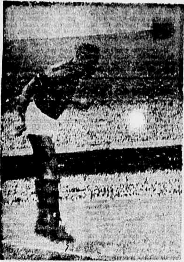
Jordan voltou ao quadro do Flamengo, durante a escuridão, e cumpriu boas atuações