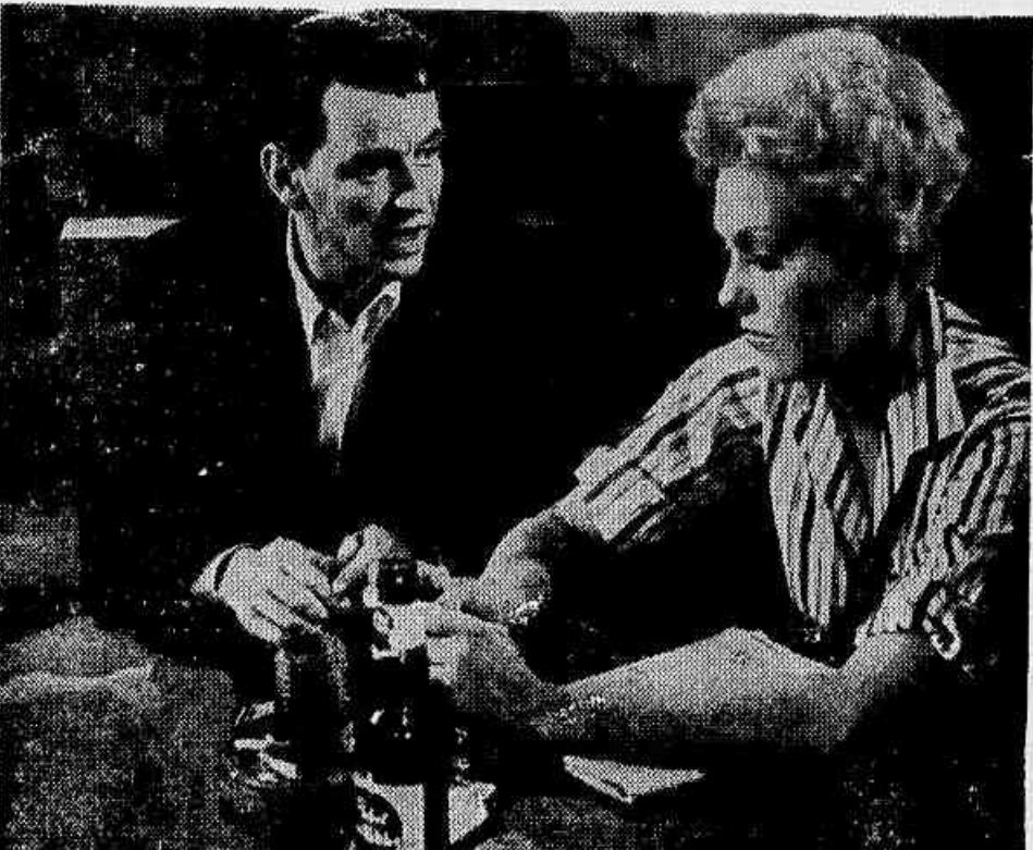
Na semana seguinte ao carnaval, será exibido nos cinemas Vitória, Copacabana, Pirajá, Miramar e América o filme "O Homem do Braço de Ouro", com Kim Novak, Frank Sinatra e Eleanor Parker. Trata-se de filme dirigido por Otto Preminger, considerado pela crítica como um bom filme. Na foto, Frank Sinatra, que faz papel de um viciado em narcóticos, Kim Novak, que faz o papel de uma jovem apaixonada por Frank.