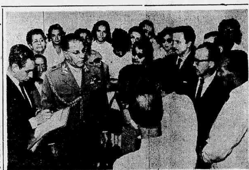
EX-COMBATENTES PLEITEIAM CASA PRÓPRIA

Esse vulcão, a curta distância da capital, estava inativo desde junho de 1917, época em que houve violenta erupção acompanhada de movimentos sísmicos, causando a destruição de numerosas casas em San Salvador e localidades vizinhas.