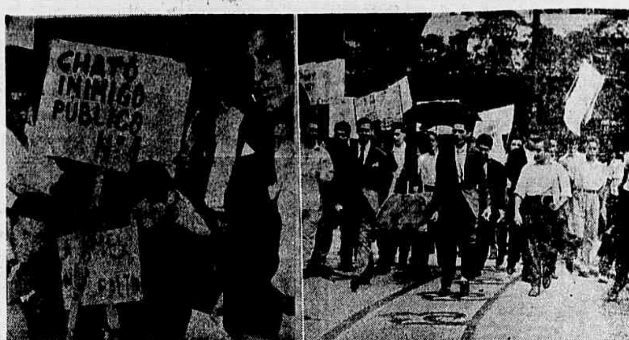
Vários cartazes ostentaram a repulsa dos estudantes cariocas ao entreguista Chato, cujo "caixão" foi conduzido pelos press. da AMES e UML

Doverão depor sete testemunhas, todas residentes nesta capital.