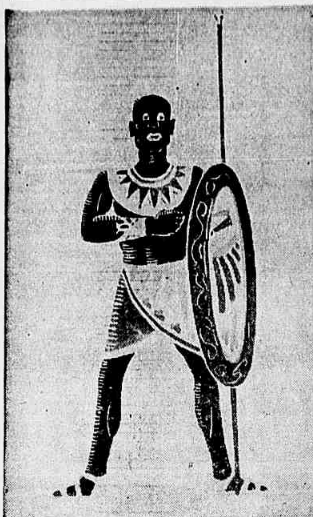
Um detalhe de "Terra dos Faróis", concepção do cenógrafo J. Guimarães Júnior, para o carnaval do High-Life este ano