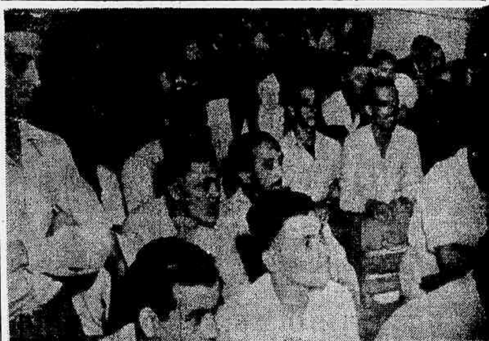
Um aspecto da grande assembleia realizada ontem pelos operários navais