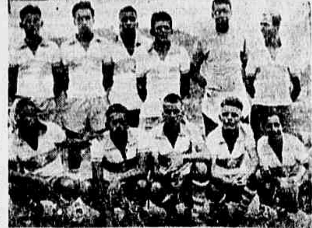
A representação do Ipiranga que buqueou diante do Brasil por 3x1