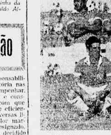
ATUANDO como verdadeiro campeão, o esquadrão do Belfort Roxo conseguiu uma brilhante vitória de 3x1 sobre o Belfort Roxo.