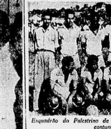
Esquadrão do Palestrino de Lucas, que impôs ao Endiabrados, contundente goleada

Iniciando as comemorações de 15.º aniversário, o Palestrino de Lucas conquistou notável triunfo diante do famoso esquadrão do E. C. Endiabrados, pelo escore de 6x3. Para muitos o placar elevando, por parecer que os de Lucas levaram "boa vida". No entanto, enganam-se os que assim pensam; este triunfo foi exclusivamente, fruto de uma notável exibição do quinteto ce-