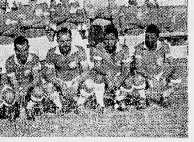
ATUANDO como verdadeiro campeão, o esquadrão do Belfort Roxo conseguiu uma brilhante vitória de 3x1 sobre o Belfort Roxo.