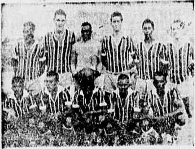
E.C. Lucas um dos vencedores da 1ª rodada, marcou 5x1 sobre o Ipiranga