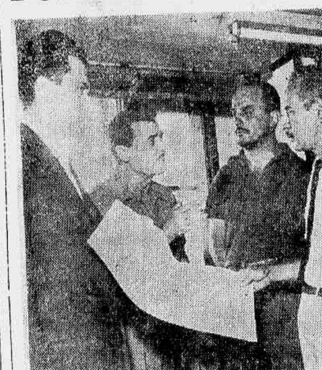
Jornaleiros em nossa redação, falam ao repórter e mostram o cartaz que pregarão por toda a cidade

Continua firme a justa greve dos vendedores de jornais e revistas contra os proprietários, que se recusam a atender as suas reivindicações.