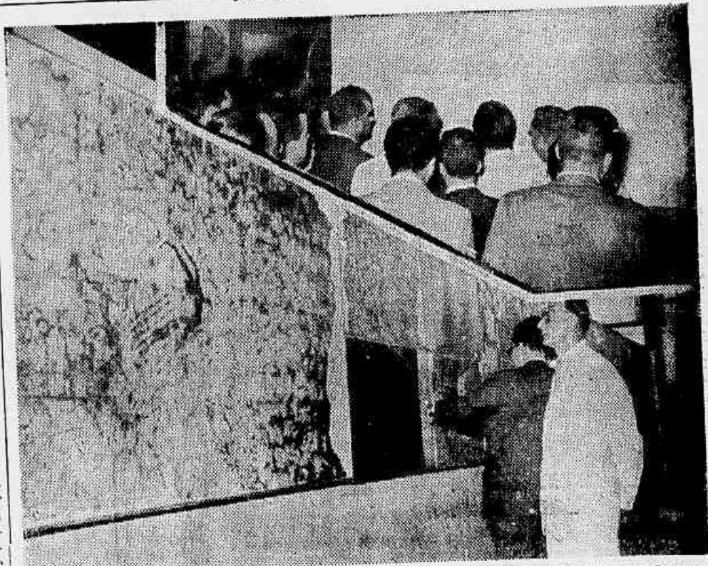
Éis um paralelo que fala por si mesmo: o do minucioso e bem elaborado projeto de Vilanova Artigas, Cascaldi e sua equipe, no painel que ocupa toda uma ala da exposição dos trabalhos, e, ao alto, a página apresentada da «sugestão» de Lúcio Costa, que um grupo de técnicos comenta com natural estranheza