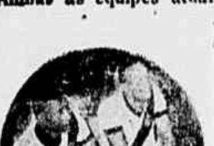
Sabará e Walter, um dos de grande valor do quinto «campeão», que estarão em ação frente aos tricolores hoje à noite

Ambas as equipes atuarão completas, integradas dos melhores valores