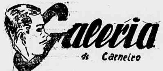
Retorno a falar do certame da «Liga de Honório Gurgel», desta feita para abordar o eterno problema que são as arbitragens.

No campeonato anterior, bem ou mau, os «juizes» tinham uma ajuda de custo para as passagens. Mas não sei porque cargas d'água na presente temporada o «Conselho de Representantes» vetou, a título de economia, o dito «pró-labore» que a meu ver viria acarretar sérios embaraços ao Departamento Técnico da entidade, pois duvidamos mesmo, sem querer ferir o quadro de juizes, (que são de clubes), que consigam manter o até o final. Pois com a medida atual de que o juiz é de determinado clube, poderá surgir muitos casos que o árbitro «fulano» prejudicou o clube «A» em benefício do seu... Fazendo-se o quadro de Juiz da Liga, remunerado, evitaremos, estou certo, estas polémicas baratas, ainda mais quando a Tabela indicar um verdadeiro «clássico».