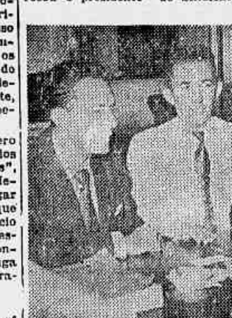
O presidente e demais diretores do Sindicato dos trabalhadores em inflamáveis, quando falavam ao nosso repórter

de gás engarrafado. O que está havendo é que algumas companhias desde que algumas delas já oferecem ao Sindicato e outras avisaram aos seus empregados que iriam pagar o adicional de periculosidade a partir de 15 de maio, e os atirados correspondentes a janeiro e fevereiro. Todavia, até o presente momento nada pagaram, — esclareceu o presidente do Sindicato