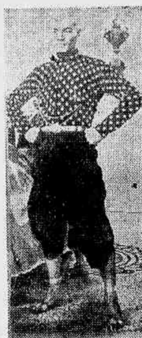
O «rei» Yul Brinner

Reportagem sobre os premiados pela Academia de Artes e Ciências Cinematográficas de Hollywood