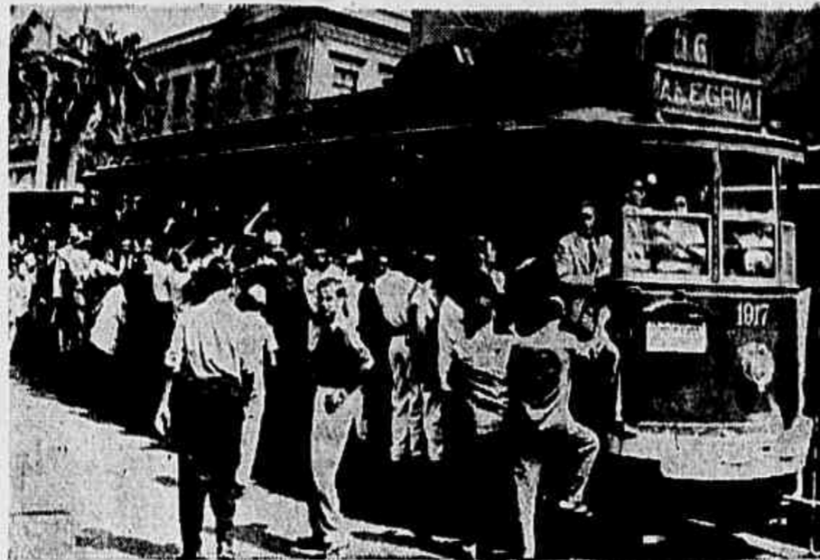
Cada bonde, como se vê no clichê, trofega com quatro ou mais vezes a sua lotação. Cada unidade, portanto, rende à Light soma idêntica a que tiraria de quatro em circulação na mesma linha. Para manter tal situação, ótima para os seus cofres, e aflição para o povo, é que os poderes públicos lhe concedem todos os aumentos de tarifas que pletica.

A associação, em causa existe desde 14 de julho de 1952, para defender as liberdades constitucionais e os direitos do homem.