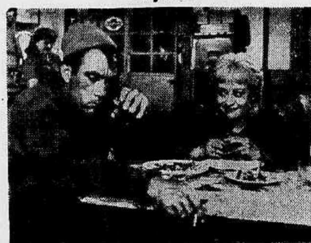
Anthony Quinn e Giulietta Masina os intérpretes de Na Estrada da Vida — melhor filme estrangeiro. No clichê uma das grandes cenas da imortal produção italiana.

Há muito vêm os funcionários públicos lutando pela classificação. Trata-se de uma aspiração de milhares de servidores, que passarão a ter aumentos periódicos em seus vencimentos e acesso assegurado aos cargos superiores de suas carreiras, tudo isso plenamente regulado e garantido em Lei.