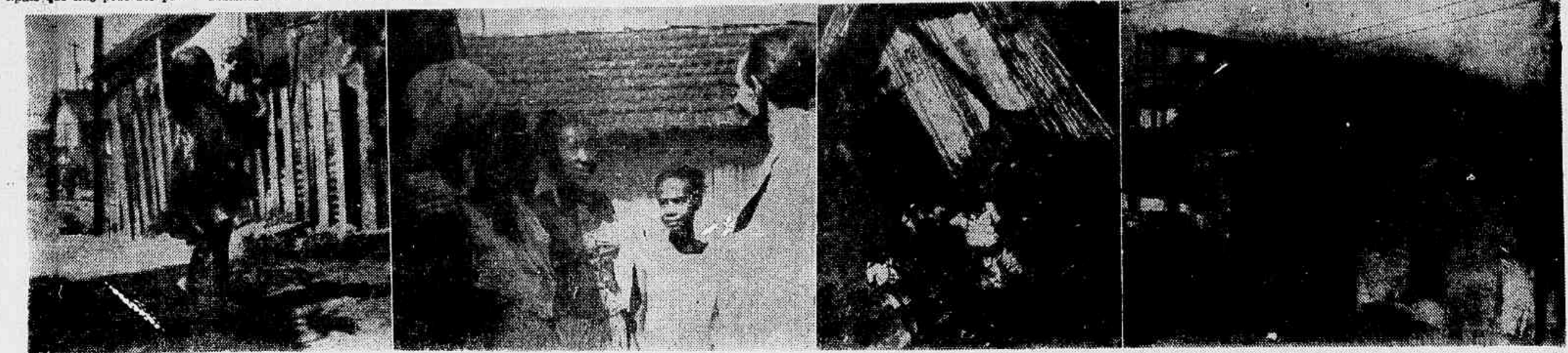
Neste mundo de zinco e madeira, milhares de pessoas se abrigam sob as más condições higiênicas. São crianças, adolescentes e velhos que sofrem toda a sorte de privações e miséria por conta da incuria dos poderes em resolverem o problema da habitação do operário, da empregada doméstica, enfim, de mais de 100.000 habitantes do Distrito Federal. Nossa reportagem reproduz aspectos da Favela do Esqueleto ali no Maracanã.

— Moro aqui com uma família de seis pessoas. Não posso me conformar em abandonar o barraco sem ter para onde ir. Acho que não está certo a Prefeitura nos jogar na rua. Por que não providenciam um lugar para nossa mudança? Conclui na 2ª página