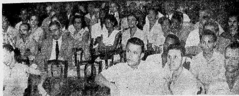
No clichê um aspecto da assembleia dos trabalhadores em moinhos