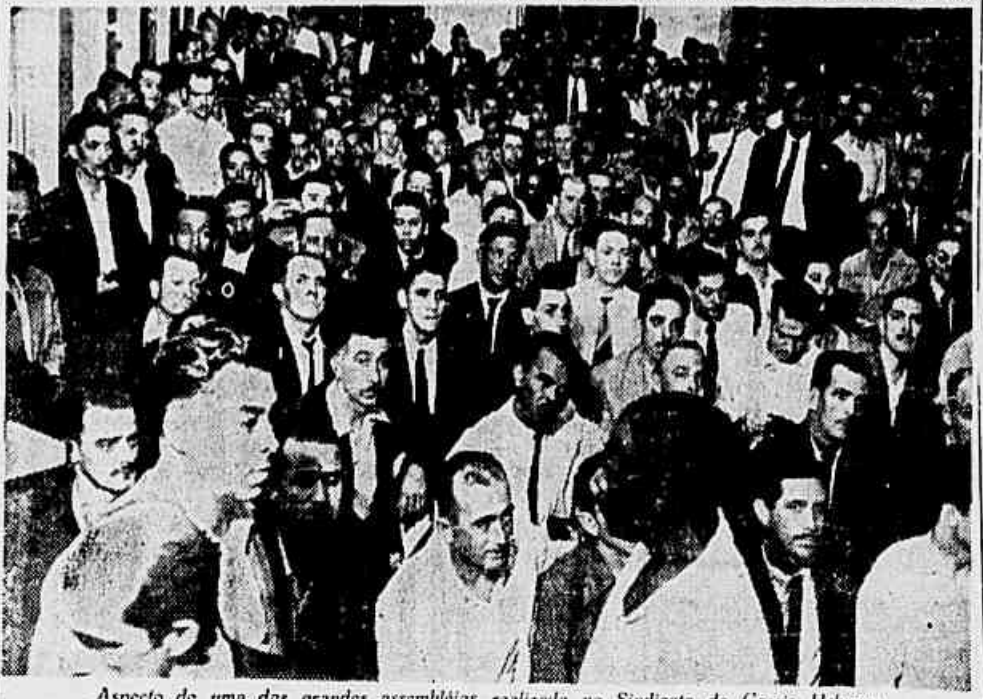
Aspecto de uma das grandes assembleias realizadas no Sindicato de Carris Urbanos

ESTA ESGOTADA. GRANDE PARTICIPAÇÃO NA ASSEMBLÉIA Em todos os locais onde trabalham aqueles trabalhado-