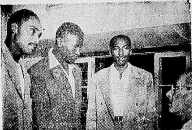
Estão ontem, em nossa redação, uma comissão de trabalhadores de Santa Cruz, da fábrica de montagem de caminhão "Berlet do Brasil S.A.", que fora à Câmara e ao Senado entregar dois abaixo-assinados com dezenas de assinaturas contra o chamado "Ajuste" de Fernando de Noronha. — (Acima, a comissão de operários de Santa Cruz.)