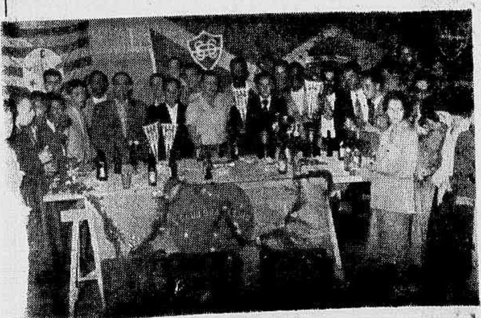
Realizou-se sábado último na sede do E. C. Salazar, da Praia do Carmo, a festa de entrega dos prêmios aos vencedores do Torneio Início. AMADORES — Campeão o River de Ramos, vice-campeão o S. C. Brasileiro; ASPIRANTES: Campeão — Cordovilense, vice-campeão — River de Ramos — ao ato compareceram, além dos filiados, grande número de desportistas e clubes circunvizinhos. No flagrante acima o presidente do "Liga Leopoldinense" quando fazia a saudação aos vencedores. A grande noite amadorista dos desportistas Leopoldinenses foi encerrada brilhantemente com um coquetel, seguido de animado baile.