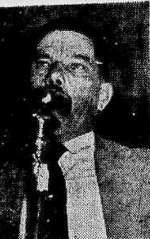
O presidente do Sindicato de Carris quando da última Assembleia, comunicava aquela corporação que o aumento estava na "estaca zero"

Os trabalhadores em Carris sentem de perto a solidão. Conclui na 2ª página