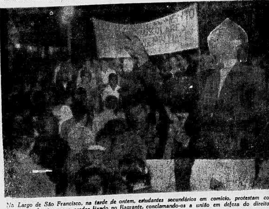
No Largo de São Francisco, na tarde de ontem, estudantes secundários em comício, protestam contra o aumento das taxas e o orador fixado no flangente, conclamando-os a união em defesa do direito da juventude à instrução