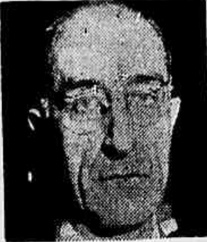
Senador Domingos Velasco