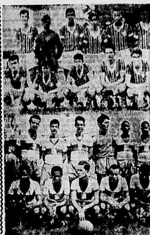
Transcorreu com grande brilho e animação o Torneio "Initium" do Infante Juvenil, promovido pelo Departamento Autônomo desdobrado em duas etapas, uma realizada no Gávea que teve como vencedor o Fluminense e a outra no barri que teve como finalista o Olaria. Assim, Tricolores e olarienses decidirão o título no próximo domingo (Nos clubes acima os dois finalistas).

Prosegue com grande animação os preparativos dos clubes e colégios, para a participação dos Jogos Infantis, competição de iniciativa do jornalista Mario Filho, diretor de Jornal dos Sports.