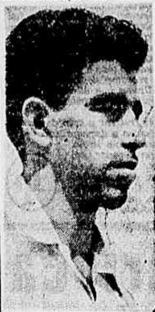
Foto focaliza Vavá comandante do campeão Carioca que tentará romper o bloqueio da retaguarda atlética.

A grande atração desportiva da noite de hoje em Belo Horizonte é a coleção entre os campeões da Alterosa e da Cidade Maravilhosa que está marcado