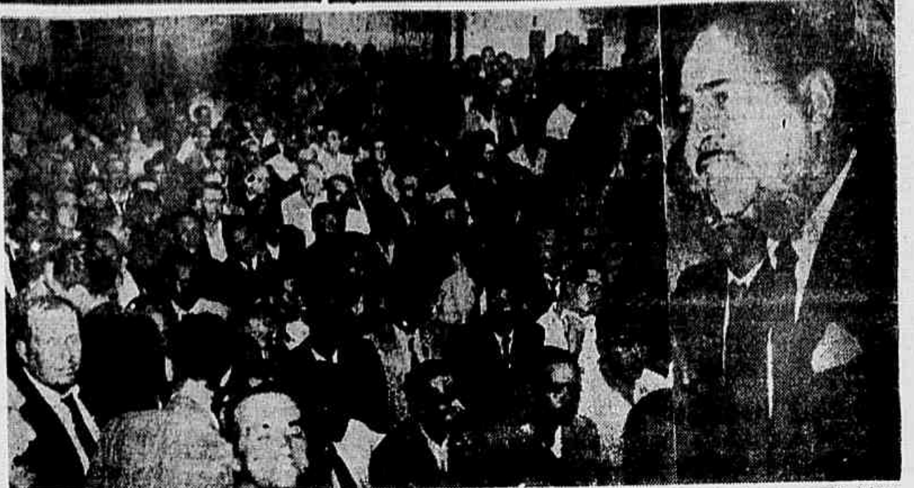
Parte da grande assembleia dos Trabalhadores em Carris que votou a greve e a direita o Secretário-Geral do Sindicato quando falava denunciando a má vontade da Light e do Governo em resolver o problema do aumento salarial da classe.

ANO X — Rio de Janeiro, Quarta-feira, 10 de Abril de 1957 — Nº 2.085