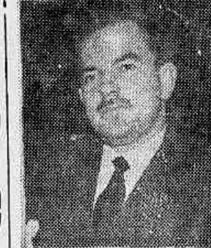
Deputado Renato Archer