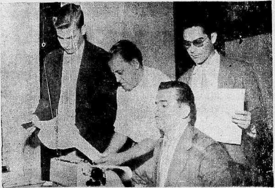
No clichê, os membros da Comissão quando da reunião de ontem, na qual foi aprovado o comunicado tornado público

de cinco membros para coordenar e dirigir inicialmente a campanha contra o pretendido aumento das passagens de bondes. Trata-se de um acréscimo injustificável às despesas que Conclui na 2ª pag.