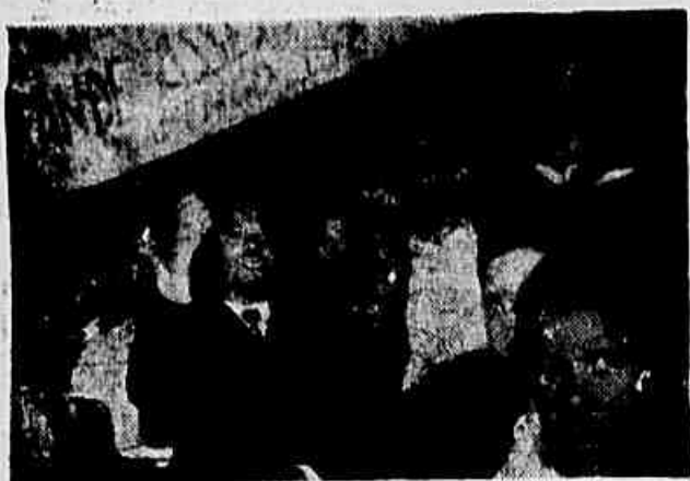
Um trabalhador quando hipotecava seu apoio a luta das estudantes contra a elevação das anuidades

Coroando os preparativos para a realização da grande assembleia estudantil hoje que marcará o início da campanha contra a elevação das taxas escolares, os estudantes secundários realizaram, ontem na Central do Brasil um movimento com o propósito de