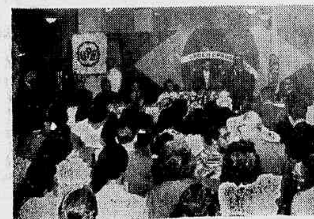
No clichê, dois aspectos da solenidade: mesa que presidiu a solenidade e assistência presente

Tomou posse, ontem, a diretoria recentemente eleita pela União dos Portuários de São Paulo. Conclui na 2ª pag.