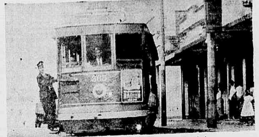
Na foto acima vemos o Bonde Irajá retido em virtude da lama

E' obrigação contratual da empresa, ao instalar as linhas, calçar meio metro de cada lado dos trilhos. No entanto, a Light não cumpriu essa obrigação. Quando chove, os passageiros são obrigados a entrar os pés na espessa camada de lama, ao descerem dos bondes.