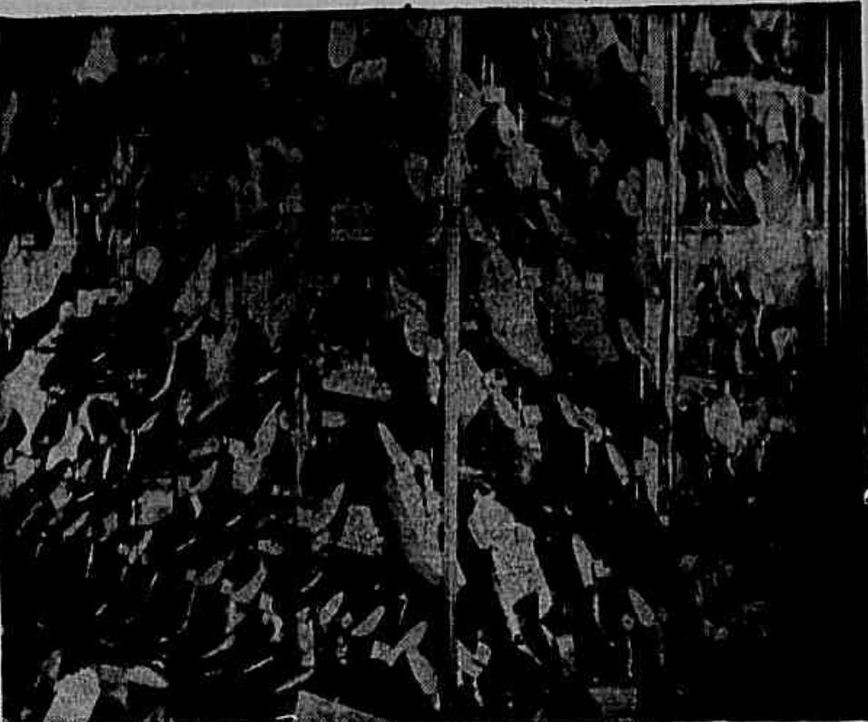
O transeunte vê os bonitos calçados nas vitrines e não o compra em vista de seu elevado preço

Finalizando declaro-nos o presidente do Sindicato dos Trabalhadores: "Gostaria que