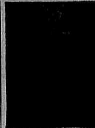
Trio atacante de São Jorge

EM QUINTINO — Alvi-negro x Val-que-m quer Guarani x Cruzeiro Gafurinha x Continental Mocidade x Sporting Unidos do Cruzeiro x Nova América (Jaquepaga)