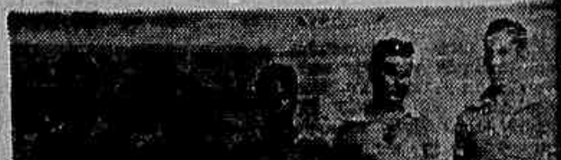
O quinto dos irmãos Goulart que estará em ação na tarde de hoje em Santa Cruz

As 14.00 h — 1º jogo — River x Lanetti As 14.25 h — 2º jogo — Del Castilho x Palestino As 14.50 h — 3º jogo — Mavilla x Atilla As 15.15 h — 4º jogo — 1º de Maio x Venc. 1º As 15.40 h — 5º jogo — Venc. do 2º x Venc. do 3º