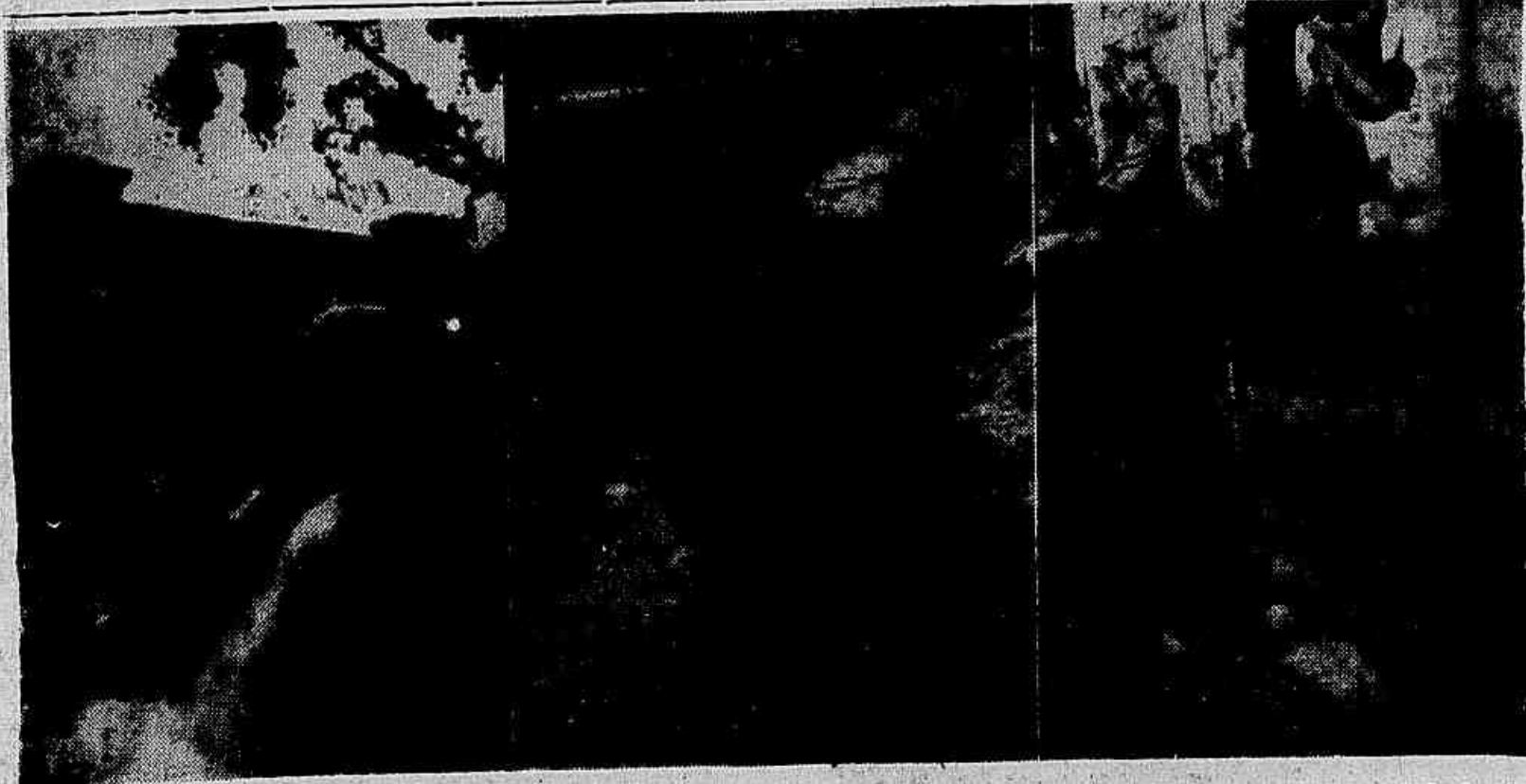
As fotos dão uma idéia das consequências do rompimento ocorrido em Benfica. Nas extremidades, dois aspectos da retirada da água, por meio de bombas, da cratera ocasionada pelo estouro da adutora; no centro, trecho da Avenida Suburbana, completamente inundada, ficando em estado paralisado.

hoje, às 11 horas e 8 minutos, de regresso a Moscou, via Budapeste. Antes de partir, o dirigente soviético conclui na 2ª pag.