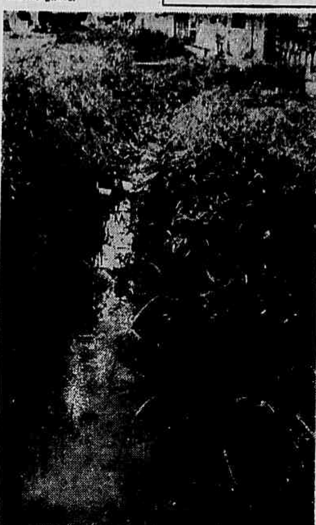
Esta vala infecta atravessa toda a Rua Humboldt. É um perigoso foco de mosquitos, que põe em perigo os moradores daquela rua

Cr$ 4.500,00. No entanto a Prefeitura lançou, por Cr$ 4.500,00 e Cr$ 5.500,00, motivo por que até agora não foram alugados.