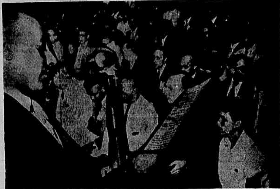
Aspecto da sessão plenária de ontem, quando era lido o relatório da Comissão de Liberdade Sindical

Foi aprovada pelo plenário a proposição da Comissão de Liberdade Sindical. Conclui na 2ª pag.