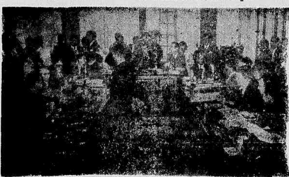
Na sessão de ontem caiu a segunda preliminar da Oposição e foi constituída comissão para ver no Itamarati o texto do telegrama 295

Na sessão de ontem caiu a segunda preliminar da Oposição e foi constituída comissão para ver no Itamarati o texto do telegrama 295 — Representante do PSD pernambucano apresentará emenda ao projeto de resolução do Relator — Hoje, em nova sessão, a consumação do atentado à Constituição