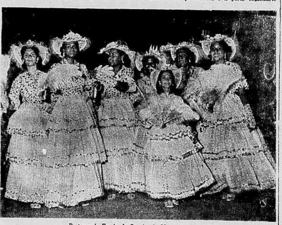
Pastoras da Escola de Samba da Mangueira em evolução