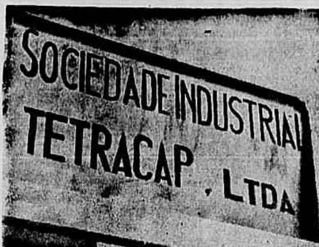
Este é o nome da empresa do trade norte-americano "Lock Joint" responsável pelo fornecimento dos tubos empregados na Adutora do Rio Guandu, e por conseguinte pela sua má qualidade.

Não resta a menor dúvida que estes constantes rompimentos da tubulação de água com os constantes prejuízos para a população carioca, não poderão ficar no esquecimento. Torna-se necessário, tendo em vista o ocorrido com os tubos da "Tetracap" que de antemão estavam condenados, que a Câmara dos Vereadores abra um rigoroso inquérito, a fim de aplicar punição aos culpados por estes prejuízos.