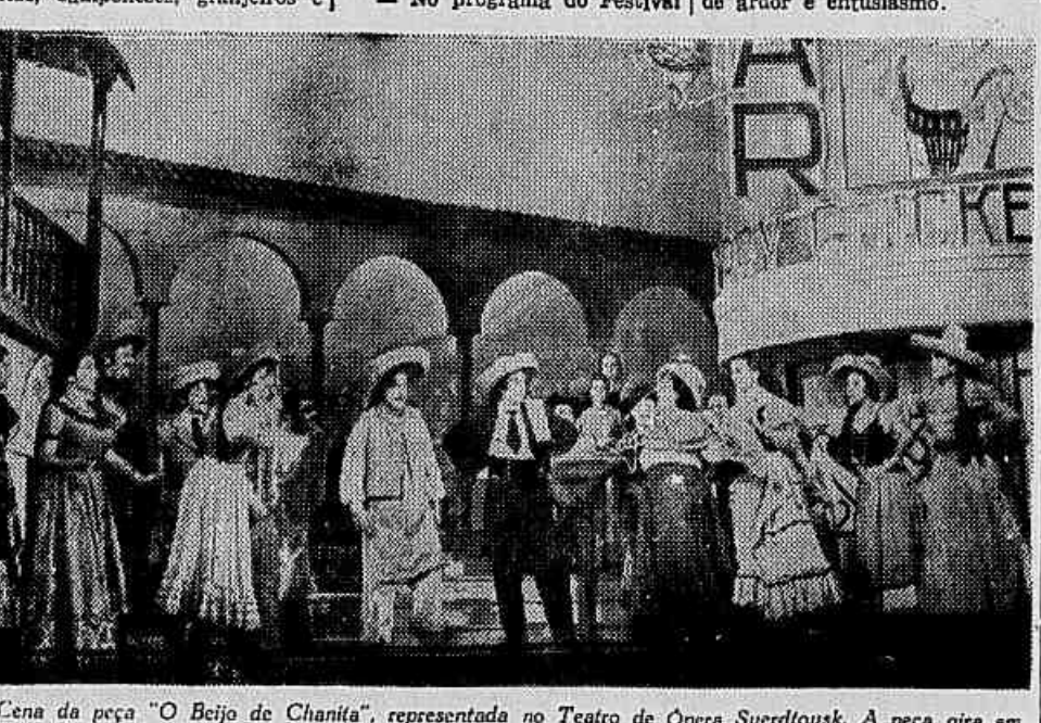
Cena da peça "O Beijo de Chanita", representada no Teatro de Ópera Sverdlovsk. A peça gira em torno de vários jovens de uma pequena cidade da América Latina que, para enviar seus representantes ao Festival Mundial da Juventude, são obrigados a vencer inúmeros obstáculos

Traços leves do que será o grandioso Festival Mundial da Juventude, para o qual prepara-se a juventude brasileira: cheia de ardor e entusiasmo.