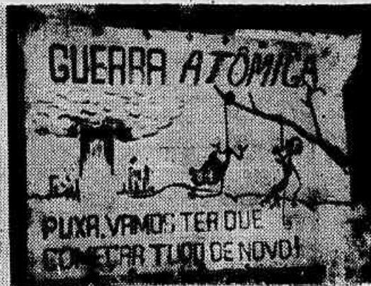
Os estudantes, momentos antes do início do "show". Chatô sendo recepcionado por seus "colegas" londrinos, e um cartaz de crítica ao belicismo atômico