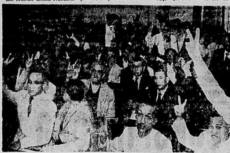
A expectativa era geral. No Sindicato dos Empregados em Escritórios centenas de marítimos aguardavam o desenrolar das negociações.

agências concedidas em acordos anteriores. 5) — Dentro de 30 dias serão regularizados os salários dos autárquicos, assim como os quadros do pessoal.