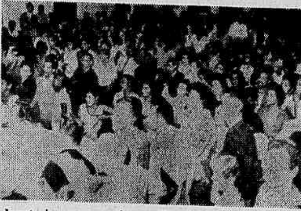
Aspecto de uma concorrida assembleia dos operários da Fábrica Confiança por ocasião da memorável campanha pela volta ao trabalho no ano passado. Apesar de serem vitoriosos até hoje continuam ainda em situação instável, tendo seus problemas sido amplamente debatidos na reunião nacional dos Sindicatos Têxteis

têxteis, ao governo, ao Congresso Nacional e ao povo: «São conhecidas em todo o país, as consequências ruins da situação que atravessa a indústria de fiação e tecelagem. Os maiores prejudicados têm sido os trabalhadores e trabalhadoras que empregam seus esforços para o progresso sempre crescente desse importante ramo da indústria manufatureira de nosso país, e para dessa indústria auferirem o necessário à sua manutenção. Tantas indústrias como as (CONCLUI NA 2.ª PÁG.)