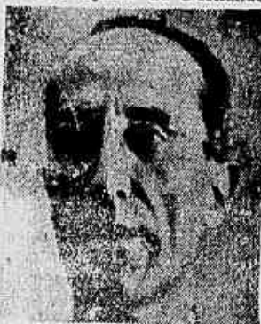
Senador Domingos Velasco

SAO PAULO, 27 (Especial para a IMPRENSA POPULAR) — Alcançou grande repercussão a conferência pronunciada, na noite de sexta-feira passada, pelo senador Domingos Velasco, no Instituto Caetano de Campos, sobre o tema «Aspectos da política exterior do Brasil e o ajuste de Fernando