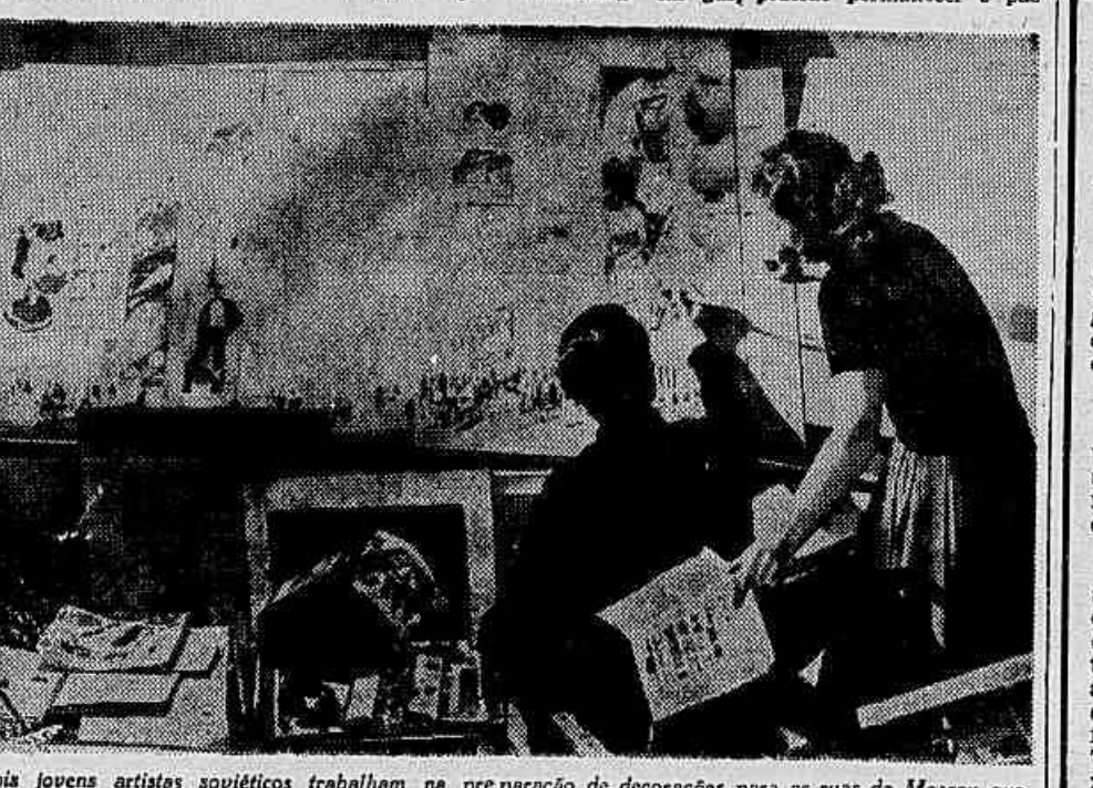
Dois jovens artistas soviéticos trabalham na preparação de decorações para as ruas de Moscou que se enfeitam durante o VI Festival Mundial da Juventude e dos Estudantes

★ Como se vê, o governo de JK está descendo muito no desrespeito à Constituição e ao próprio Código Penal, que requer a caracterização do delito e a individualização do delinqüente para a aplicação de sanções. Agora precisará o cidadão andar munido de folha corrida e mandato de segurança! Mesmo assim não escaparia a constrição e a atropelagem. Quem foi que prometeu uma campanha eleitoral assegurar os direitos constitucionais? PEDRO VELHO