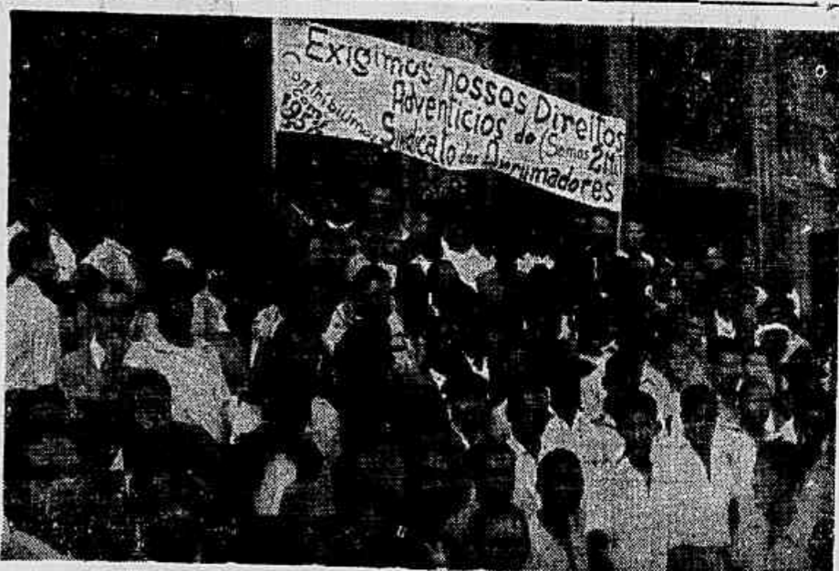
OS «ADVENTICIOS» DO CAIS DO PORTO realizaram ontem uma concorrida concentração em frente ao Ministério do Trabalho, quando foram apresentados aqueles Ministérios as suas reivindicações. No último domingo, os «adventícios» realizaram uma importante assembleia, da qual damos amplo noticiário na quinta página. Na foto, um aspecto da concentração.

Repercutiu Amplamente nos Estados Unidos a Entrevista de Kruschiov à Televisão Ianque. Divulgado domingo à tarde o importante programa da Columbia Broadcasting System — O intercâmbio amistoso, o desarmamento, a convivência pacífica de sistemas políticos diferentes — Não há motivo para guerra — Bulgária fala a um grupo de mulheres norte-americanas (Texto na terceira página)