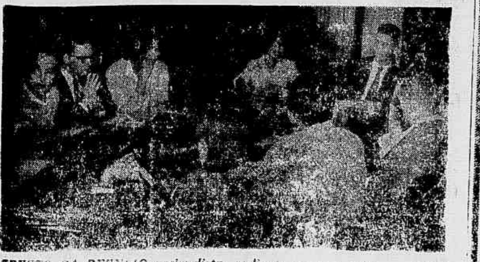
ASPECTO DA REUNIÃO nacionalista, realizada ontem a noite em São Paulo, com a presença de 147 membros da Frente Nacionalista.

Em carta dirigida aos partidos preparatória do voto de confiança a que se deverá submeter, perante a Assembleia, (CONCLUI NA 2ª PAG.)