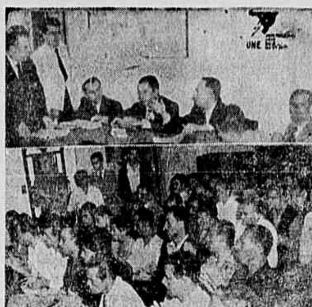
Aspecto da Assembleia dos Vendedores Ambulantes, vendo-se parte do plenário e a mesa que dirigiu os trabalhos