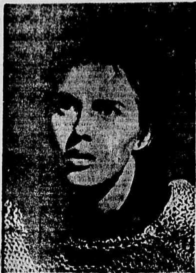
Jean Seberg a jovem intérprete de Santa Joana de Otto Preminger adaptação de uma peça de Bernard Shaw

(Filme inglês de Otto Preminger, adaptado em uma peça de Bernard Shaw)