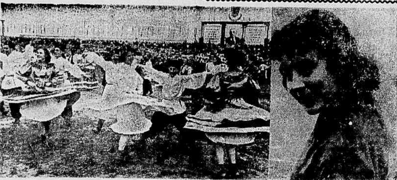
FESTIVAL DA JUVENTUDE EM MOSCOW — Prosseguem em toda a URSS os preparativos para o próximo Festival que será realizado em Moscou com a participação de milhares de jovens de todo o mundo. Na foto à esquerda, grupos folclóricos e esportivos de KUBAN, quando da realização do Festival de Kuban, no território de Krasnodar. A direita, a conhecida artista de circo da Inglaterra, Roma Toledo, que declarou: «Quero ir a Moscou para conhecer bem o circo e a arte teatral russa»

O que se pôde adiantar desde já é o que o sr. Valadares, desejoso de emergir do ostracismo em que se encontra, não encontraria nem mesmo quem o levasse a sério nessa empreitada de juntar os casos de «pacificação» entreguista e anti-democrática, inteiramente desmoralizada e repudiada pela opinião pública e pelas correntes progressistas dos partidos da Maioria e da Oposição.