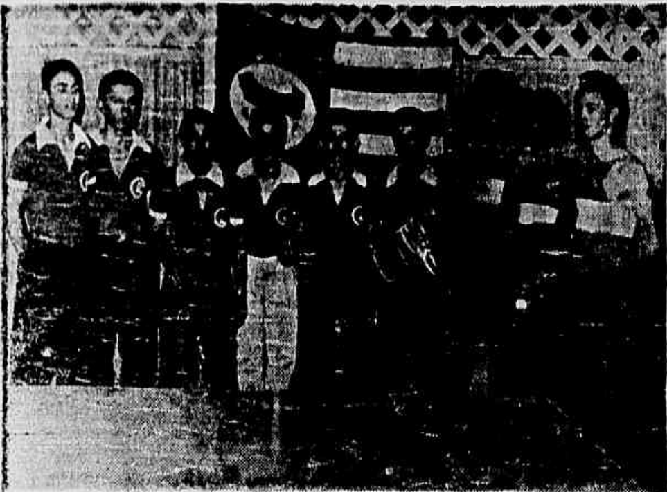
BRILHOU O S. C. SAICAN NO TENIS DE MESA

Recentemente, como parte dos festejos de aniversário do G. E. Pompeu, foram realizados vários jogos de "Tênis de Mesa", entre o grêmio aniversariante e o S. C. Saican da Praça do Carmo. A guisa rapaziada de Zona Leopoldina saiu vencedora em todos os jogos, demonstrando grande eficiência. No flagrante acima vemos os representantes de ambos os clubes, confraternizados antes de uma partida na sede do S. C. Saican.