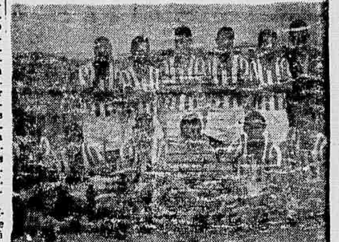
Os disciplinados atletas do primeiro quadro do Barros Filho, que ocupa um dos primeiros postos da "Liga Disciplinada", da Liga de Honório Gurgel.

do o Barros Filho orgulhar-se de estar entre os poucos clubes que podem representar com dignidade e nome do esporte Amador na sua mais elevada expressão.