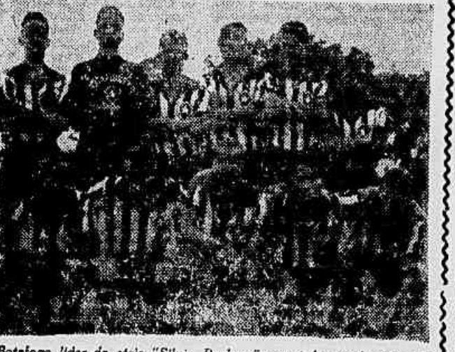
Botafogo líder da série "Silvio Pacheco" que é franco favorito no jogo com o Lisboa