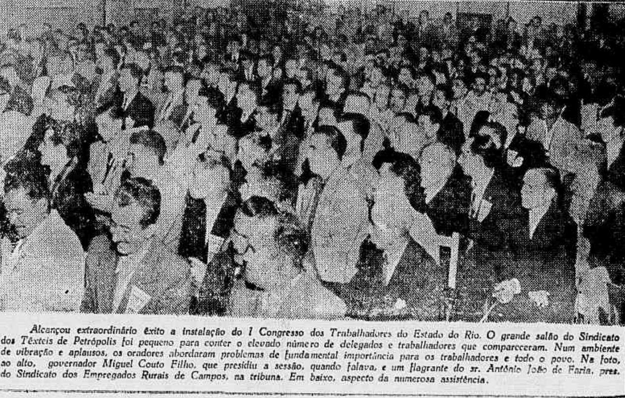
Alcanceu extraordinário êxito a instalação do I Congresso dos Trabalhadores do Estado do Rio. O grande salão do Sindicato dos Têxteis de Petrópolis foi pequeno para conter o elevado número de delegados e trabalhadores que compareceram. Num ambiente de vibração e aplausos, os oradores abordaram problemas de fundamental importância para os trabalhadores e todo o povo. Na foto, ao alto, governador Miguel Couto Filho, que presidiu a sessão, quando falava, e um flagrante do sr. Antônio João de Faria, presidente do Sindicato dos Empregados Rurais de Campos, na tribuna. Em baixo, aspecto da numerosa assistência.

Aumento de salários e combate à carestia — Contra a entrega de Fernando de Noronha — Defesa das liberdades — Reforma agrária — Relações com todos os países — Unidade nas empresas e sindicatos, no âmbito municipal e estadual — O governador Miguel Couto presidiu a instalação — Personalidades presentes — (Também na 5ª pag.)