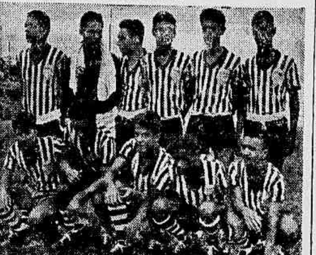
Nova América que corre sério perigo frente o Olaria

A praza foi palco de dois contenciosos, correndo a interferência pela sua movimentação e entusiasmo, o conjunto do Dí-