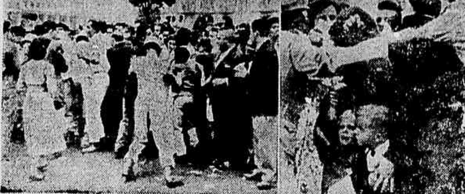
A saídas, pontal-pés e barrachudas foram tratados os curiosos ao longo do cordão de isolamento, guardado de extremo a extremo por soldados da Polícia Militar. Nem mulheres e crianças escaparam às ordens brutais, baixadas a fim de que os curiosos fossem mantidos à distância na mais rigorosa proteção à figura de prôa do odiado salazarismo

Frieza dos espectadores ao longo do passeio, poucos edifícios ornamentados, a maioria das sacadas da Avenida desertas e fracasso da empresa contratada para atirar papel cortado — Nem o vivório da claqué, nem o barulho de sirenes, motocicletas e fanfarras pôde ocultar o desinteresse do povo pelo sócio de Salazar