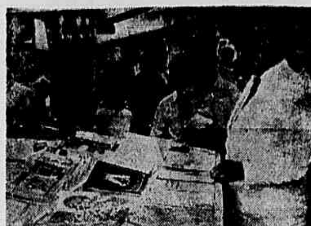
As barracas da Feira de Livros sempre proporcionaram ao carioca a oportunidade de comprar novos livros.

Inauguram-se hoje as comemorações da II Semana Nacional do Livro — Solenidades na Praça Floriano, às 16 horas — A nova «feira de livros» permanecerá na Cinelândia até o dia 5 de julho — O programa de festas da Semana do Livro de 1957