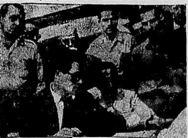
Componentes da Chapa do Sindicato dos Hoteleiros em visita à nossa redação, quando encareciam a necessidade de um grande comparecimento às urnas.