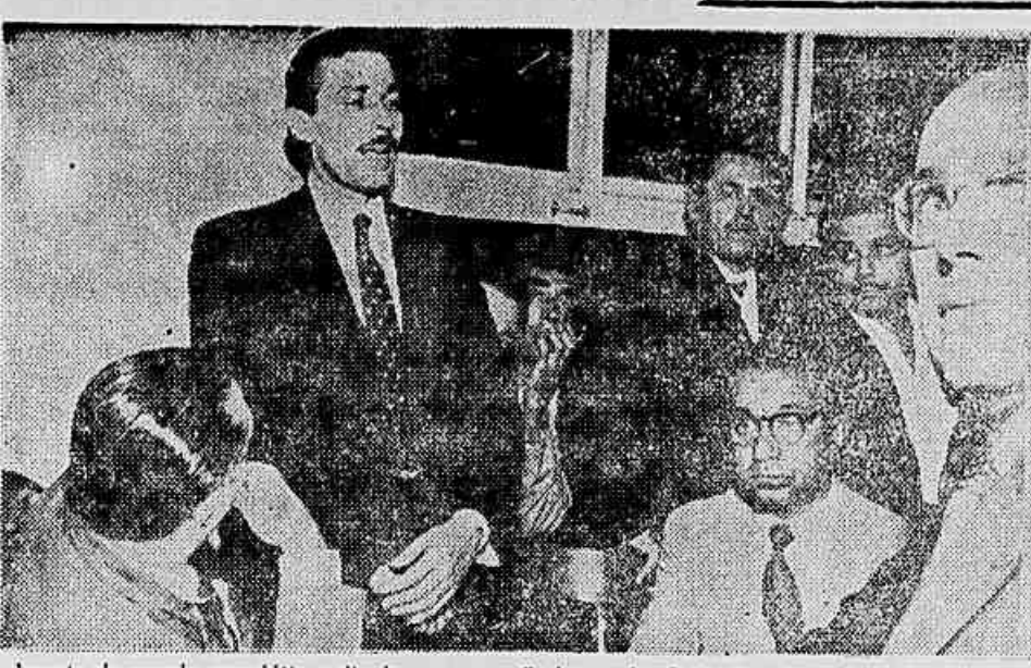
Aspecto da grande assembleia realizada ontem no Sindicato dos Radiotelegrafistas, quando foi aprovada a tabela de aumento de salários.

VITÓRIA DOS TRABALHADORES. Nossa reportagem ouviu um dos diretores do Sindicato dos Trabalhadores em Empresas Radiotelegráficas, que nos informou ter a cor-