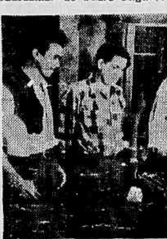
A Comissão de Sapateiros em nossa redação.

Estêve ontem, em nossa redação uma Comissão de sapateiros da fábrica de calçados «Gardânia» de Padre Miguel,