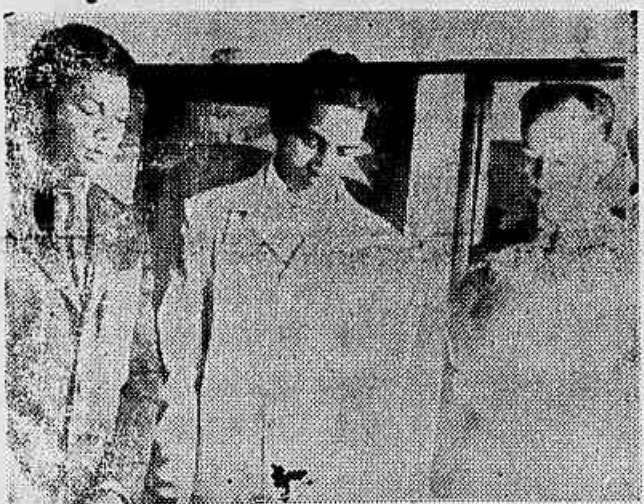
Uma comissão de patriotas residentes em Olaria esteve em nossa redação a fim de comunicar que fez a entrega, ao deputado Seixas Dória, de um memorial solicitando a sua intercessão, junto à Câmara, no sentido de que entre em funcionamento a comissão parlamentar de inquérito para examinar a política exterior do Brasil. Dessa visita é o flagrante acima.