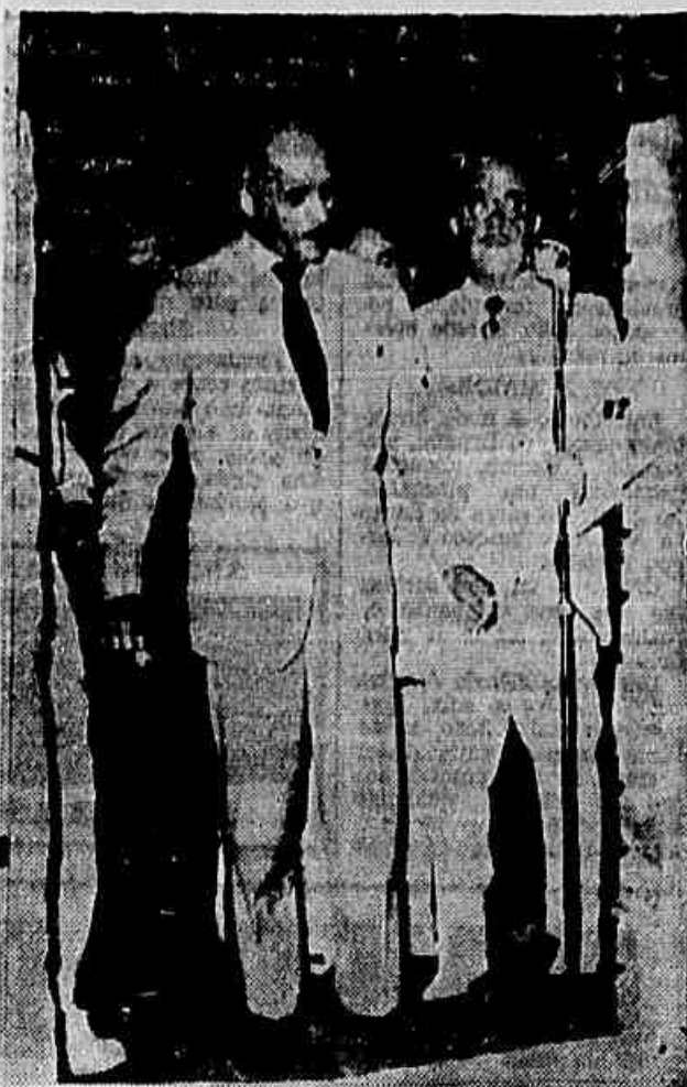
O deputado Getúlio Moura, quando inaugurava a escola pública instalada na sede do E. C. Califórnia

Espera-se que a Câmara Municipal, em seu novo período ordinário de reuniões, a instalar-se no próximo dia 3 de julho, examine a questão do prédio do Ginásio Municipal Monteiro Lobato, que vai ser construído diretamente pela Prefeitura, com um orçamento de 8 milhões de cruzeiros. Como não houve concorrência pública — exigida por lei — como o presidente do Legislativo alega que a obra vai custar apenas 4 milhões de cruzeiros, há grande expectativa popular em torno do pronunciamento dos vereadores, a respeito do «panamá» preparado pelo prefeito Ary Schlavo.