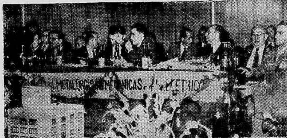
Aspecto da mesa que dirigiu a solenidade, vendo-se, em primeiro plano a maquete da nova sede do Sindicato dos Metalúrgicos

cos se reunirão em assembléia na sede do Sindicato dos Têxteis, para a eleição do Comitê de Greve e dos componentes das Comissões coordenadoras do movimento: Transporte, Manutenção e Esclarecimento.