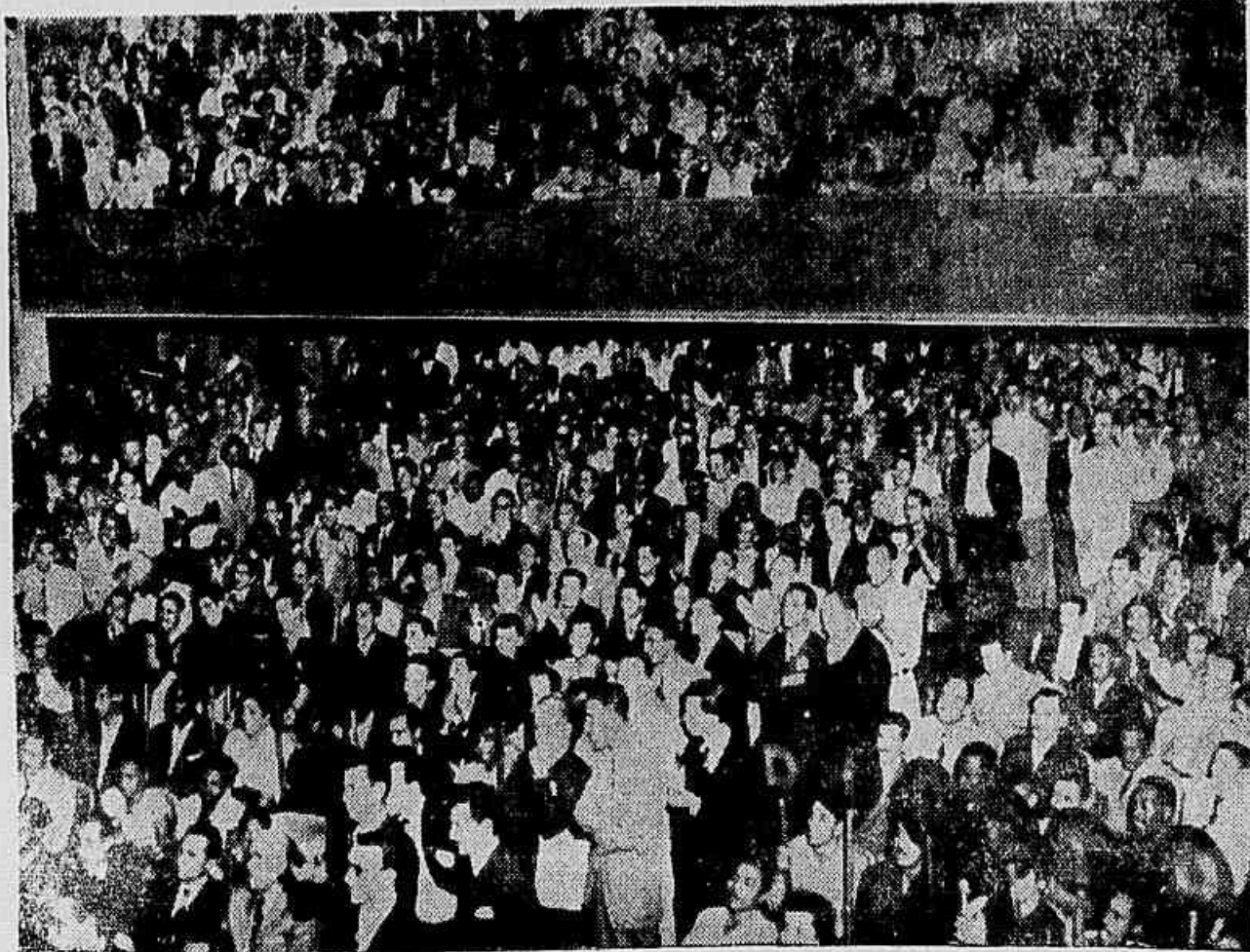
Considerável massa de trabalhadores lotou, ontem à noite, todas as dependências do auditório da ABI

GRANDE ACONTECIMENTO A POSSE, ONTEM, DA DIRETORIA DO SINDICATO