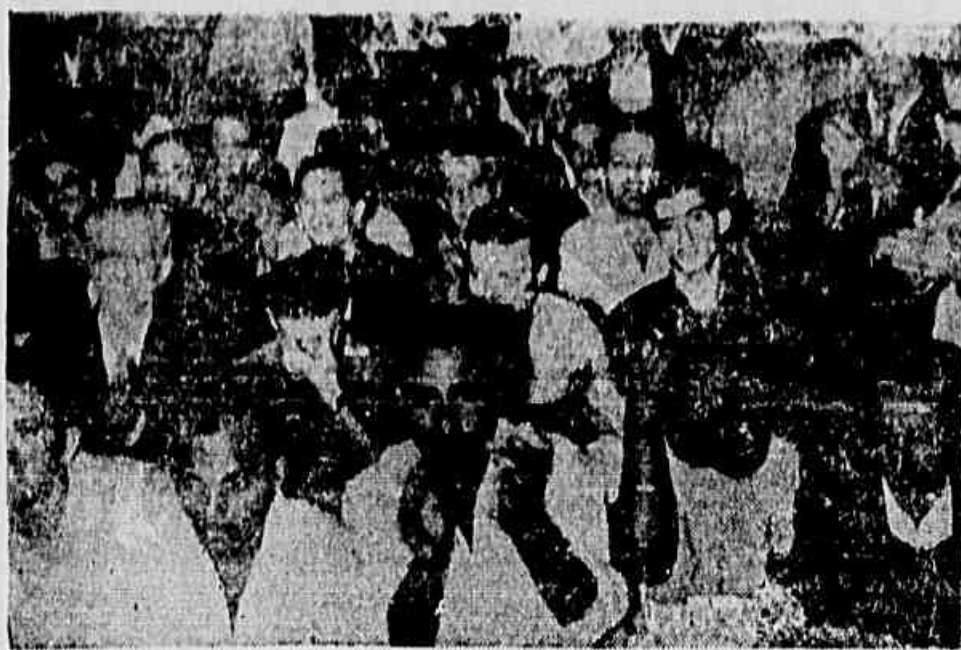
Aspecto da assembleia do dia 2 do corrente que deliberou a greve dos sapateiros para o proximo dia 22