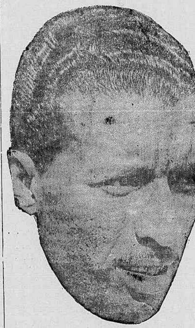
Mestre Ziza continua sendo uma grande atração. Hoje, ele estará em Medellin, na Colômbia e sua presença é um fator de interesse pelo jogo. Hoje, também, no Maracanã, o Brasil enfrentará seu nome esportivo, contra o nosso tradicional rival a Argentina. É bem possível que algum torcedor recorde o nome de Ziza. Ou será o craque esquecido na embriaguez de uma vitória brasileira?

Em Bogotá, o tricolor enfrentará o Santa Fé — Em Medellin, o alvi-rubro preliará contra o Independiente — Ziziho, a grande atração