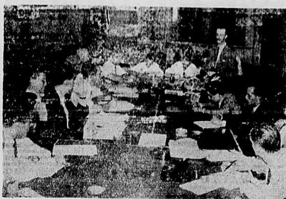
Os bancários discutem a tabela Nacional, aspecto da reunião de maio ultimo