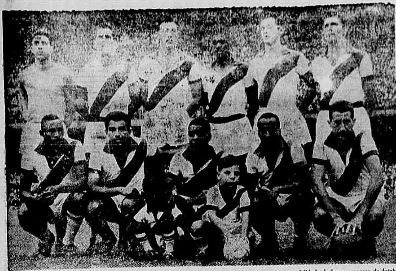
A poderosa equipe do Vasco da Gama, que, na União Soviética, terá sobre os seus ombros a responsabilidade de honrar o nome do futebol brasileiro e estreitar a amizade entre os dois povos