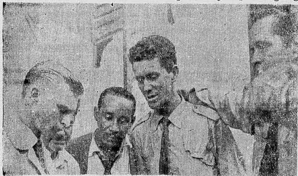
Esperamos que o projeto venha a ser levado à prática — afirmam os motoristas ouvidos pela reportagem da IMPRENSA POPULAR

Profissionais do volante aportam os benefícios que a providência viria trazer: serviço de taxis mais eficiente e extinção da exploração dos garagistas