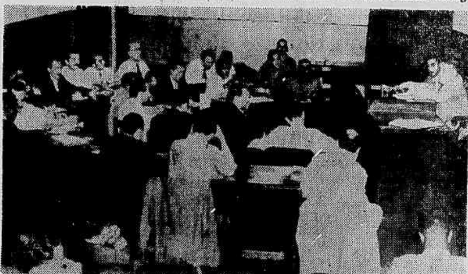
A reunião do Conselho da Federação dos Marítimos, quando ontem discutia a aprovação dos termos do Pacto de Ação Comum em defesa das empresas do patrimônio nacional

Rejeição de qualquer iniciativa visando a transformação das empresas marítimas, portuárias e ferroviárias nacionais — Revogação pura e simples da lei que criou a Rede Ferroviária Federal S/A — Recorrerão até a greve em defesa de suas reivindicações — Homologação, agora, em assembleias de todos os sindicatos marítimos e das outras categorias