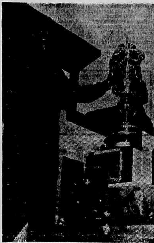
Um atleta vascaíno ao lado da "Taça Herrera", o mais rico troféu jamais conquistado pelo Vasco da Gama

Na palestra que a reportagem de IMPRESSA POPULAR manteve com alguns jogadores vascaínos, este expressaram sua alegria e o entusiasmo pelas homenagens de que foram alvo nos países por que passaram. Cada partida, disseram os cruzmaltinos, era uma festa de confraternização. Vavá, confessou que sentira saudade das cidades da gente, que durante a excursão teve oportunidade de conhecer.