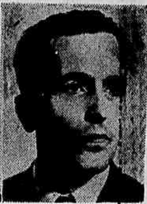
LUIZ CARLOS PRESTES

"Ao CC do PCUS. Apoiamos e saudamos com entusiasmo a firme posição do CC do PCUS na luta contra o grupo antipartidário que se opunha à aplicação das decisões de vosso XX Congresso e que tentava minar as fileiras de vosso Partido. Manifestamos nossa inteira solidariedade com vosso Partido e sua direção, certos de traduzir os sentimentos da classe operária e do povo brasileiro que aspiram à paz e lutam contra a política agressiva dos círculos belicistas dos Estados Unidos e de seus agentes no Brasil. As medidas por vós tomadas contra o grupo fracionista muito contribuirão para diminuir a tensão internacional e reforçar no mundo inteiro a luta pela paz e pela coexistência pacífica entre países de regimes diferentes. Vossa firme posição na defesa da unidade do Partido muito nos estimula no combate em que nos empenhamos em defesa dos interesses da classe operária e do povo brasileiro, em defesa da unidade de nosso Partido e, ao mesmo tempo que nos ajuda a prosseguir na luta contra o sectarismo e o dogmatismo em nossas fileiras,