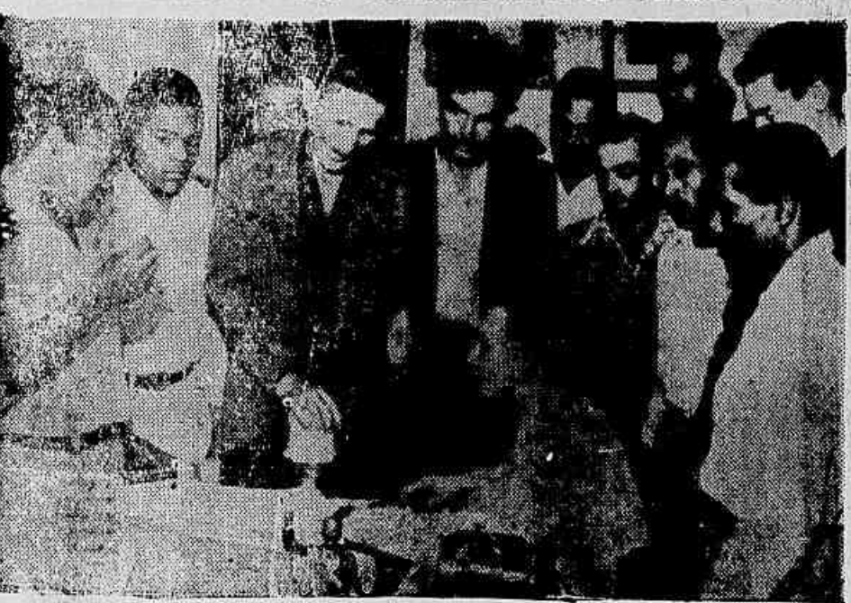
Uma comissão de trabalhadores em construção civil (foto) veio ontem, à nossa redação protestar contra o gesto do presidente da República, sr. Juscelino Kubitschek, entregando a construção de obras de Brasília a uma empresa norte-americana. Os membros da comissão afirmaram à reportagem que já procuraram o Clube de Engenharia, levando a seus diretores todo apoio para posição patriótica que assumiram em defesa da indústria brasileira de construção.