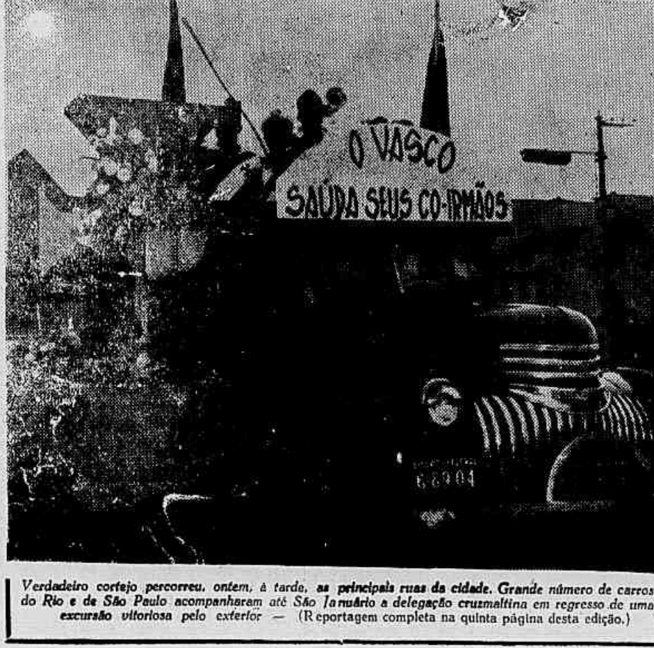
Verdadeiro cortejo percorreu, ontem, à tarde, as principais ruas da cidade. Grande número de carros do Rio e de São Paulo acompanharam até São Januário a delegação cruzmaltina em regresso de uma excursão vitoriosa pelo exterior — (Reportagem completa na quinta página desta edição.)