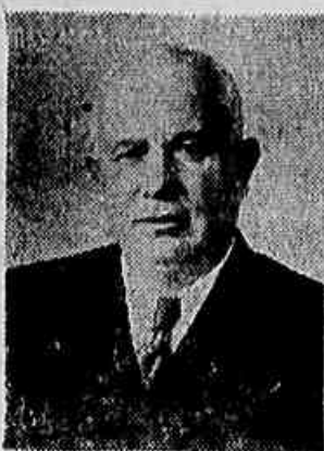
NIKITA S. KRUSHCHOV

reforça nossa luta em defesa do marxismo-leninismo contra os ataques de revisionistas e de todos aqueles que procuram dar uma interpretação oportunista às históricas decisões do XX Congresso do PCUS.