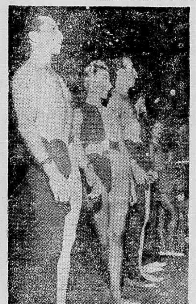
O circo é uma família. Todos vivem juntos as apreensões e alegrias. E se tratam como irmãos

ou trapezistas. Estudam, no início, como qualquer criança, mas, fatalmente, encerram a vida como profissionais de trapezistas. Estudam, no início, como qualquer criança, mas, fatalmente, encerram a vida como profissionais de trapezistas.