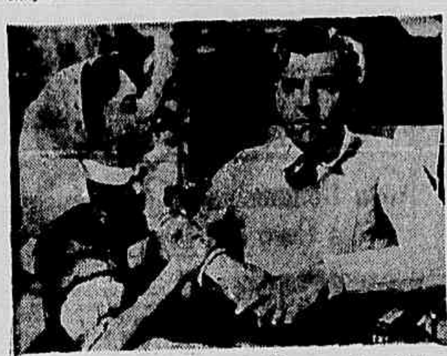
Uma cena dramática de O Céu ao Seu Alcance, com Kenneth Moore

NUNCA será demais repetir que os bons filmes não necessitam de telas panorâmicas, processos ditos maravilhosos, montagens luxuosas, e menos ainda de coloridos. Podemos mesmo dizer que, desde que temos visto esses processos «Scope» e «Vision», de lentes anamórficas, extrínsecas, fabulosas, sistemas estereoscópicos, «Hi-Fi», e não sabemos mais quantas outras coisas de nomes complicadíssimos, ainda não vimos espantosos cinematográficos que se comparasse a muitos que apreciamos em outras épocas.