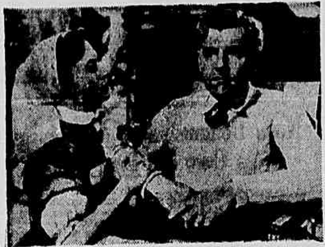
Uma cena dramática de O Céu ao Seu Alcance , com Kenneth Moore

Assistindo agora a Reach for the Sky , mais se fortalece nossa convicção de que o bom cinema pode ser feito com simplicidade.