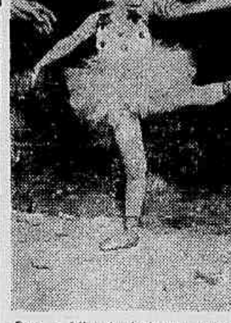
Para a filha da bailarina, quase com os primeiros passos começa o ensino de "ballet"

O «toni» «Piolita», argentino de nascimento, sintetizou isso numa expressão bem simples: «Tutti buona gente». «Piolita», apesar de ser o mais velho, vive em completa harmonia com os seus colegas «Lingüica» e «Batatinha». Entre eles, a palavra «toni» significa o mesmo que «palhaço» para nós, naturalmente despida do sentido pejorativo que a segunda expressão, sugere.