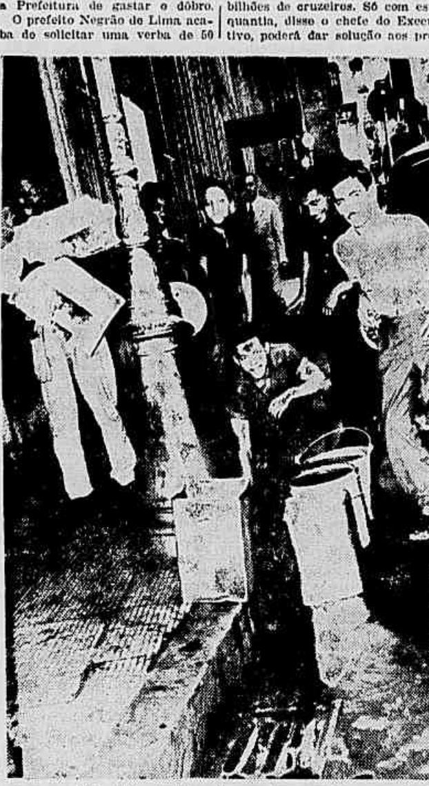
Enquanto 200 milhões de litros d'água sobram no Rio, a população continua de lata na cabeça. Pobre povo carioca!

Vem sendo levado a efeito, desde o dia 6 deste mês, na cidade de Campos, Estado do Rio, o XIII Congresso dos Estudantes Campistas, promovido pela Federação dos Estudantes de Campos, que comemora o 24.º aniversário de sua fundação. Para comemorar esses dois acontecimentos foi organizado um programa que se iniciou com a inauguração de uma exposição ilustrativa no edifício dos Correios e Telégrafos, pelo prefeito municipal, seguindo-se competições desportivas, conferências, sessões plenárias etc. O encerramento dar-se-á no próximo dia 14, com uma festa de confraternização na sede da FEC.