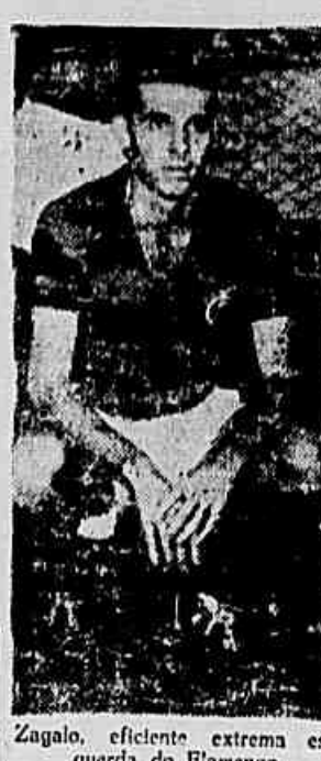
Zagal, eficiente extrema esquerda do Flamengo

A equipe do Benfica está calma e confiante em suas possibilidades, ainda mais depois do empate de sábado último. Oito Glória não tem problemas e espera colocar em