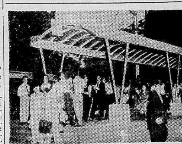
A população da zona norte da cidade foi ontem surpreendida pela chamada «Operação Zona Norte», traiçoeiramente levada a efeito pelas autoridades. Tanto populares como motoristas, ouvidos pela nossa reportagem, externaram seu descontentamento em face das modificações que a mencionada operação introduziu no tráfego. Segundo os depoimentos, as providências adotadas não constituem solução. Na foto, passageiros, num dos abrigos, quando aguardavam transporte. (Texto na sexta página.)