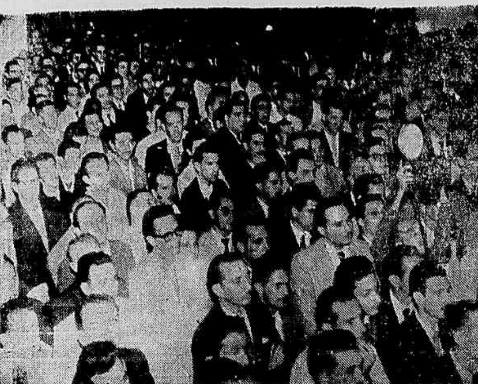
A foto acima é um aspecto da concentração no saguão do Palácio do Trabalho

Entregue um memorial ao ministro do Trabalho — Os banqueiros não aceitam a mesa-redonda nacional, mas estão dispostos a tratar do aumento de salários em caráter regional — Reunião hoje da Comissão Executiva Nacional dos Bancários com o ministro Parsifal Barroso