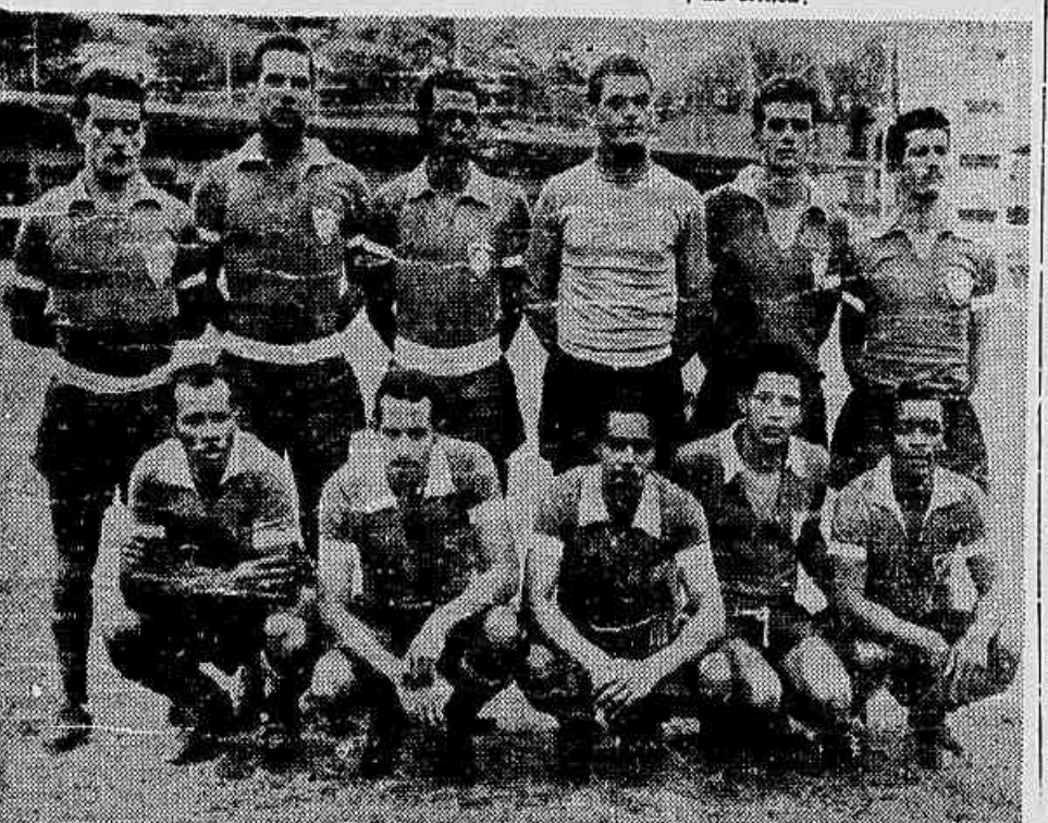
A equipe do Canto do Rio, que se apresenta em boa forma

Sensacional triunfo obteve a sã, principalmente a sua defesa, o Canto do Rio, ante o América, que se apresentou com um time fraco.