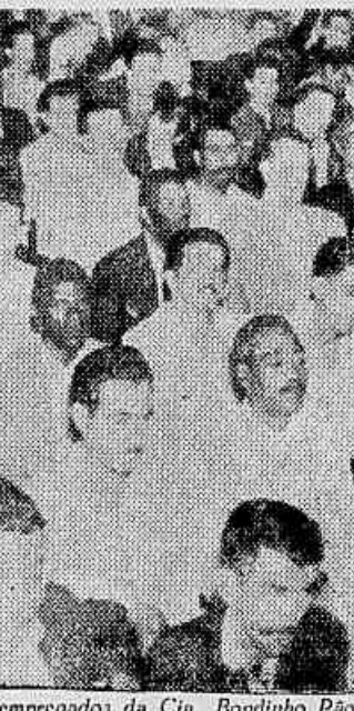
O plenário da assembleia dos empregados da Cia. Bondinho Pão de Açúcar e Carris Urbanos realizada no Sindicato

deixando de pagar todos os meses 15 dias de salários. Para os trabalhadores de carris tomarem uma decisão definitiva, será realizada uma assembleia que provavelmente, terá lugar na próxima sexta-feira.