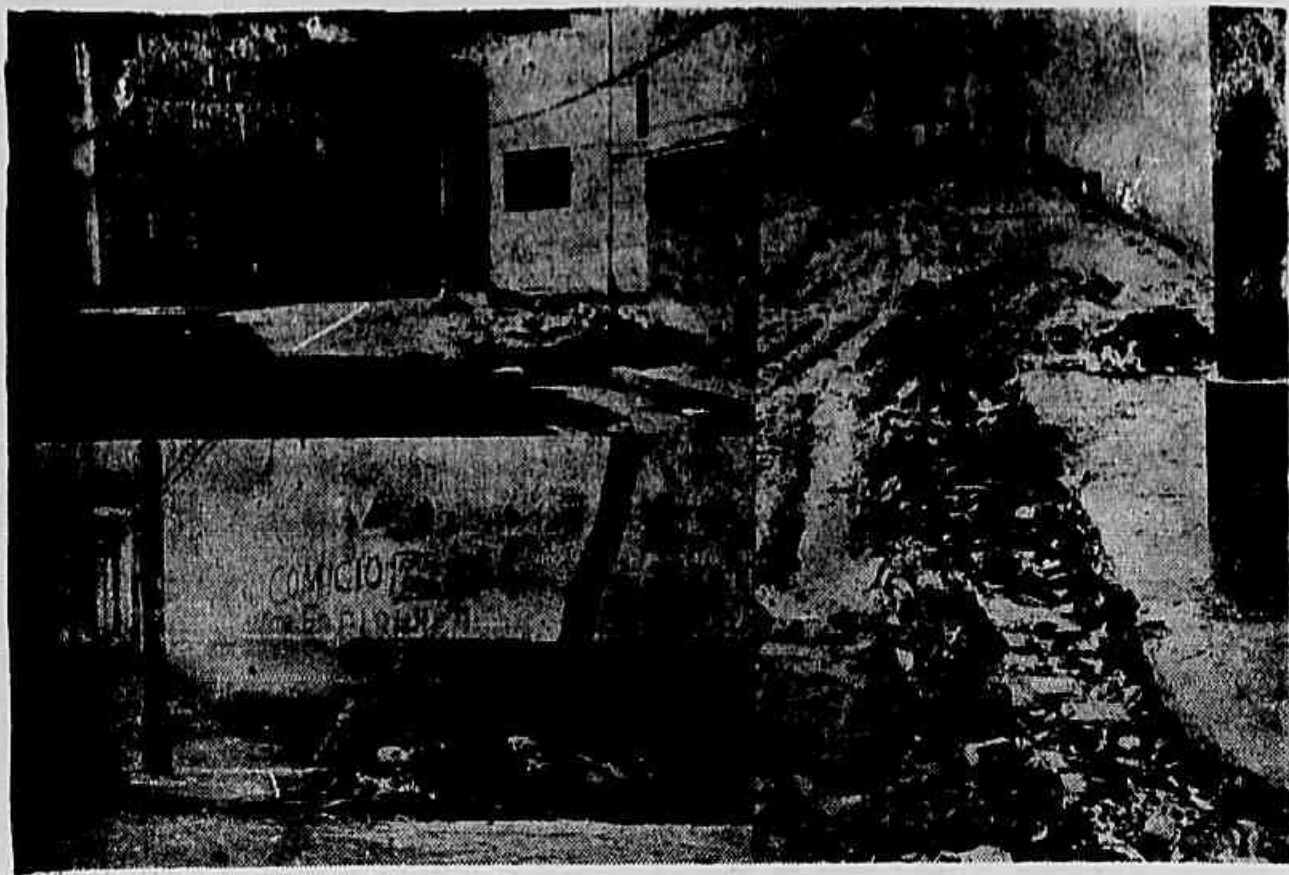
Se fotograficamente o bairro da Saúde, Lima, lixo e buracos por todo o canto. Em cada esquina um monturo, a prova eloquente de que aquele logradouro foi riscado dos mapas da Prefeitura