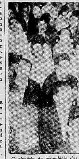
O plenário da assembleia dos empregados da Cia. Bondinho Pão de Açúcar e Carris Urbanos realizada no Sindicato

deixando de pagar todos os meses 15 dias de salários. Para os trabalhadores de carris tomarem uma decisão definitiva, será realizada uma assembleia que provavelmente, terá lugar na próxima sexta-feira.