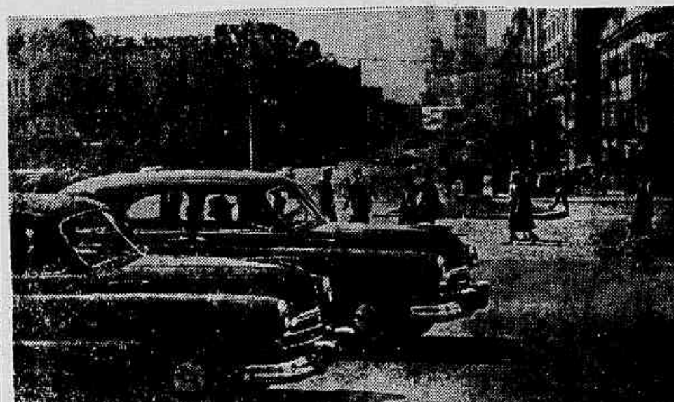
A Rua Bolshaya Sadovaya é uma das belas artérias de Moscou, onde jovens de todo o mundo se reuniram no VI Festival da Juventude

Já em Moscou os delegados da Indonésia, Coréia e China — 200 jovens na delegação canadense — Em viagem os representantes da Inglaterra — Navio soviético transporta franceses e italianos