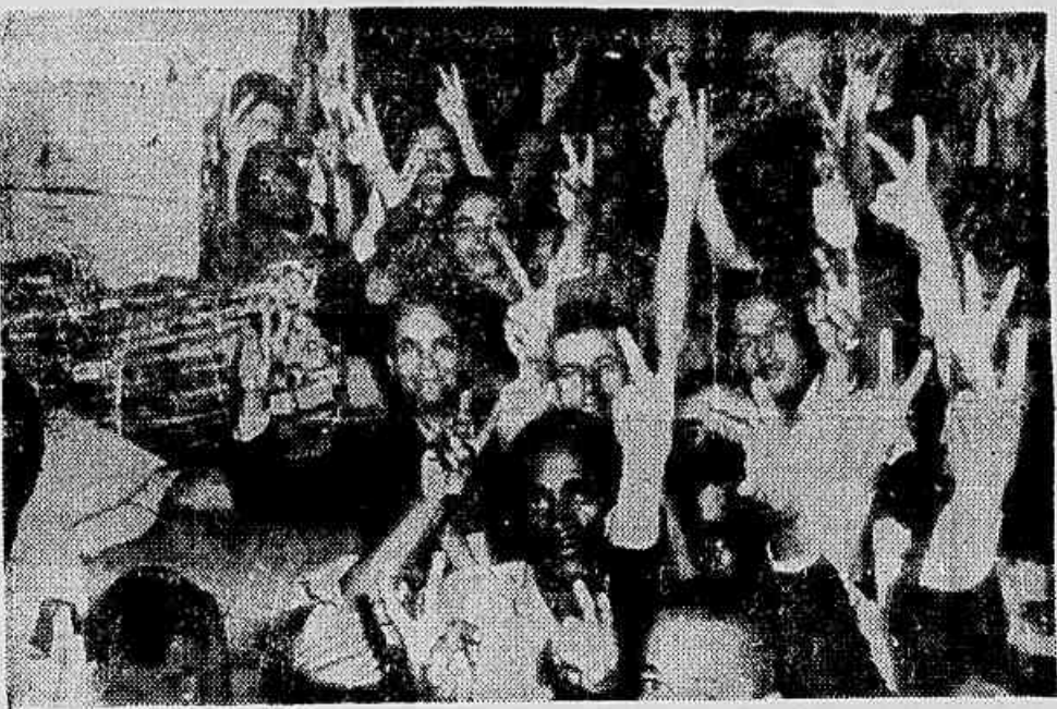
Fazendo o V, símbolo da confiança na vitória da luta que empreendem, os grevistas posaram para nossa objetiva, no lado dos gêneros recebidos pelo sindicato

A intransigência do presidente patronal viola a vontade dos pequenos e médios industriais, que desejam firmar um acordo com os grevistas — Milhares de quilos de gêneros alimentícios doados ao sindicato — Concentração, hoje, às 15 horas, no Ministério do Trabalho